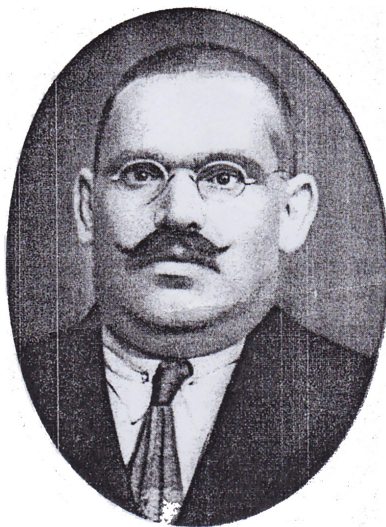
Яни Иванов Михов (1875 – 1929).