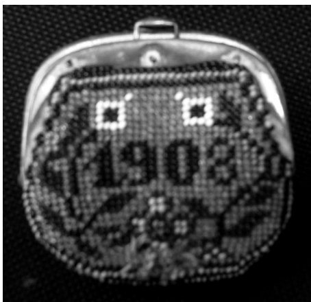
Портмоне, принадлежало на Петко Тодоров