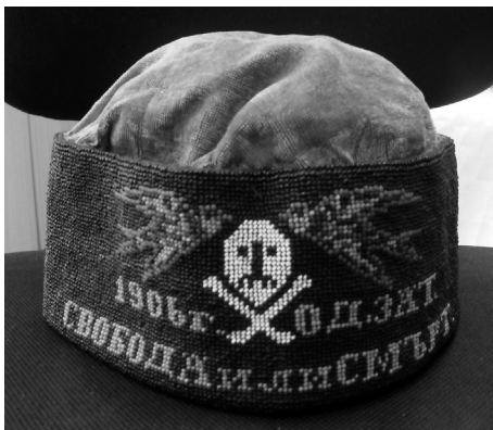
Калтак, изработен от Лефтер Мечев