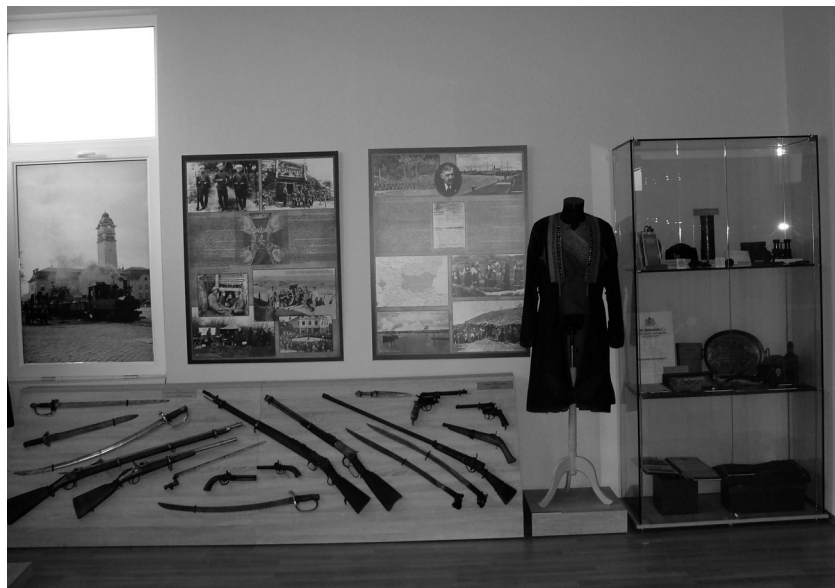
РИМ – Бургас. Експонати, свързани с Илинденско-Преображенското въстание