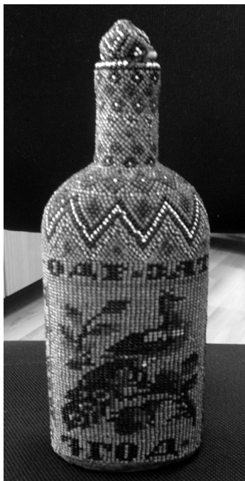
Шише, изработено от Димитър Арнаудов