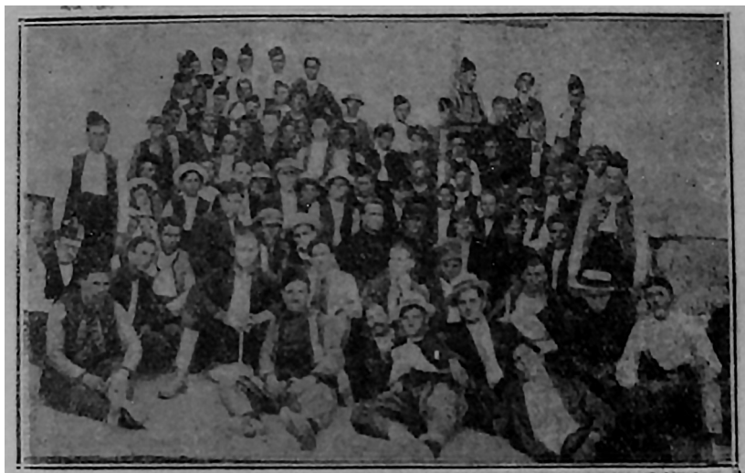
Околийско младежко тракийско събрание в Свиленград, 1924 г.