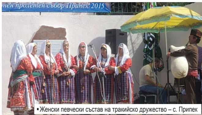
Женски певчески състав на тракийско дружество – с. Припек

Традиционният събор в село Припек (област Кърджали) по повод селищния празник и тази година събра стотици хора – освен жителите на селото, гости на празника бяха дошли и от съседните села и махали. Вече години наред съборът се утвърди с това, че обединява хората и се превръща във фактор за укрепване на българщината в Родопите. Месеци преди това кипи трескава подготовка с участието на много младежи, ученици и дори децата от детската градина.