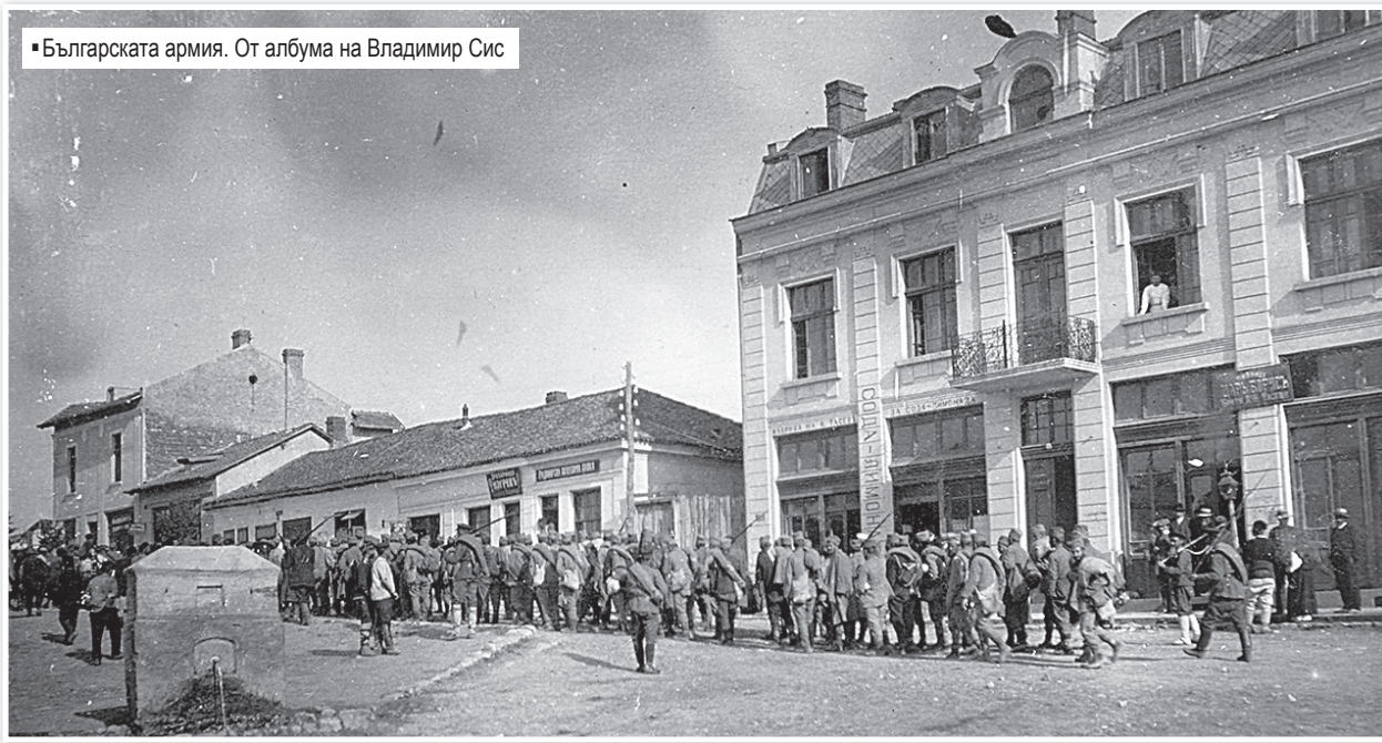
Българската армия. От албума на Владимир Сис