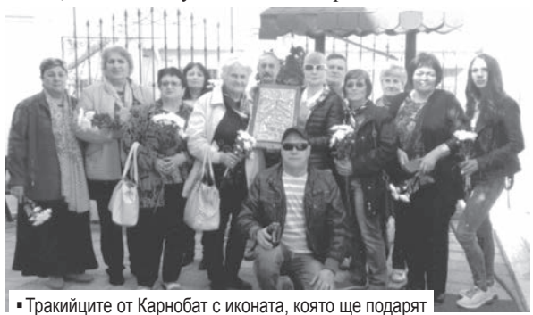
■ Тракийците от Карнобат с иконата, която ще подарят