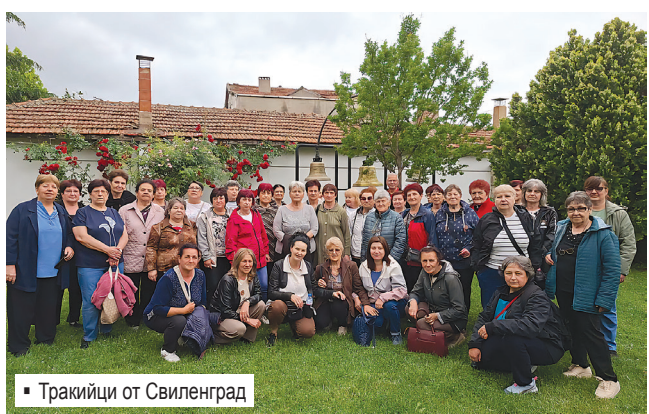
Тракийци от Свиленград