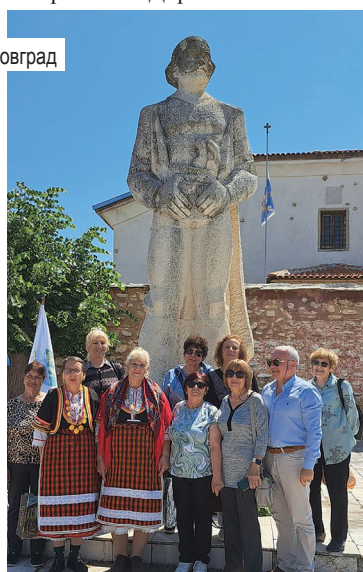
■ Стара Загора