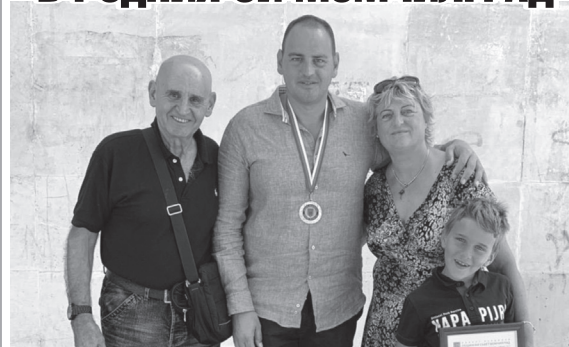
Петър Стойчев с родителите си и малкия си син.