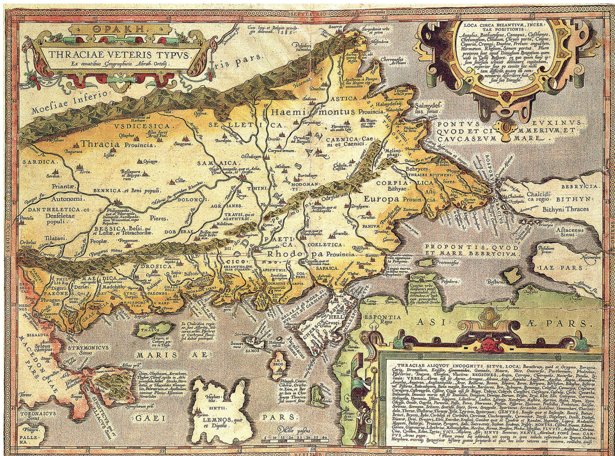
• Карта на древна Тракия. 1585 от Абрахам Ортелиус, дарение от Регионален исторически музей – Бургас и Сдружение „Морски стовор“ – Бургас за възстановяване на проекта „Картографският образ на Странджанския край през вековете“ като експозиция на открито на Петрова нива