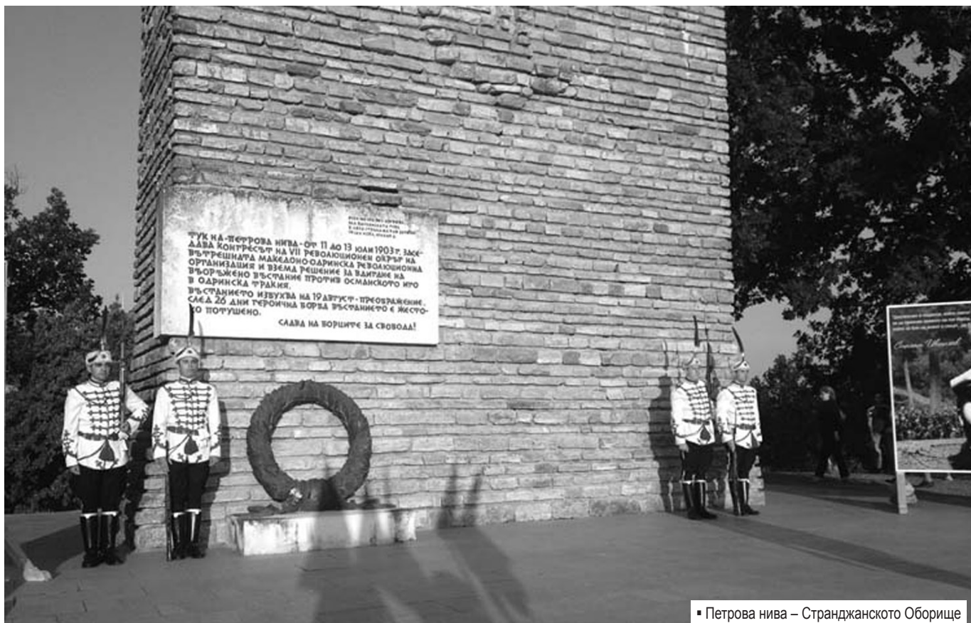
Петрова нива – Странджанското Оборище

* Авторът е дипломат от кариерата, дългогодишен посланик, племенник на войводата.