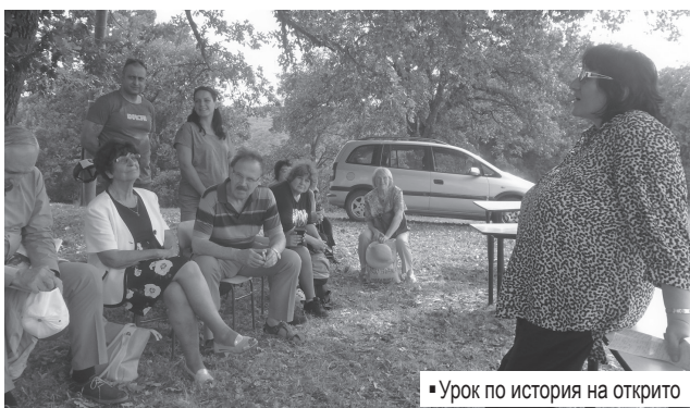
Урок по история на открито

денско-Преображенското въстание на две – на Илинденско, като тяхно македонско, и на Преображенско, като наше българско, а също и да разделят дейците на освободителната борба на македонци и на българи.