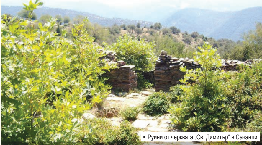
▪ Руини от черквата „Св. Димитър“ в Сачанли