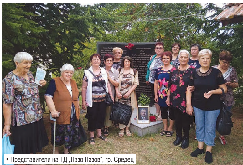
▪ Представители на ТД „Лазо Лазов“, гр. Средец