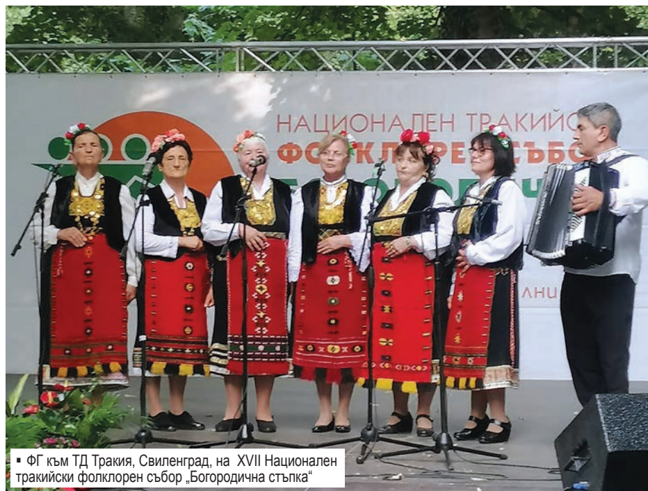
■ ФГ към ТД Тракия, Свиленград, на XVII Национален тракийски фолклорен събор „Богородична стъпка“