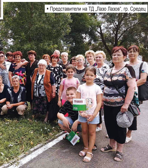
▪ Представители на ТД „Лазо Лазов“, гр. Средец