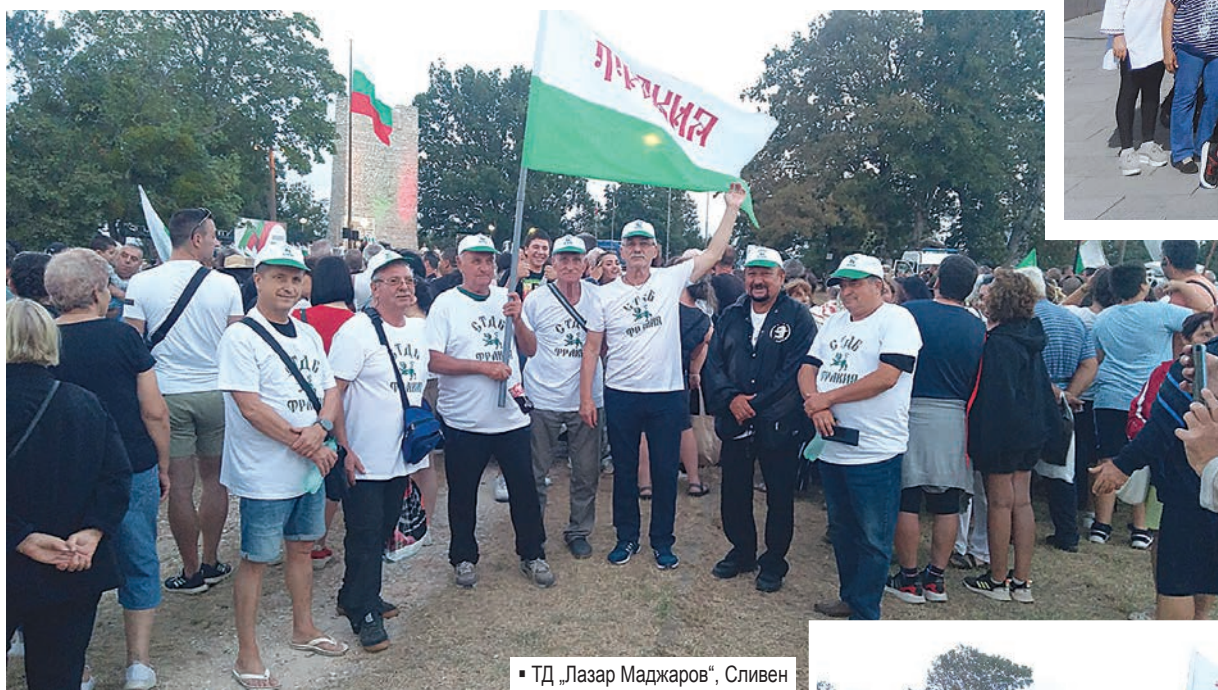
▪ ТД „Лазар Маджаров“, Сливен