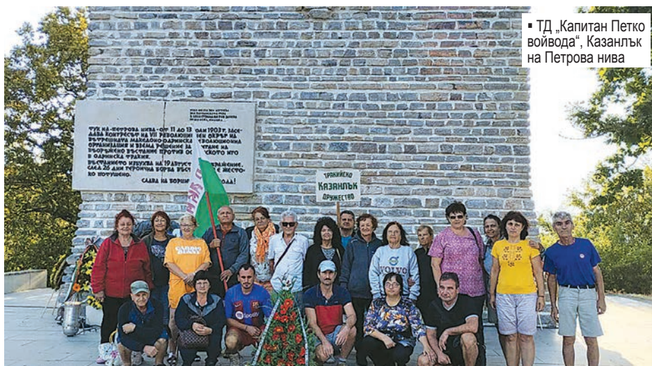
▪ ТД „Капитан Петко войвода“, Казанлък на Петрова нива