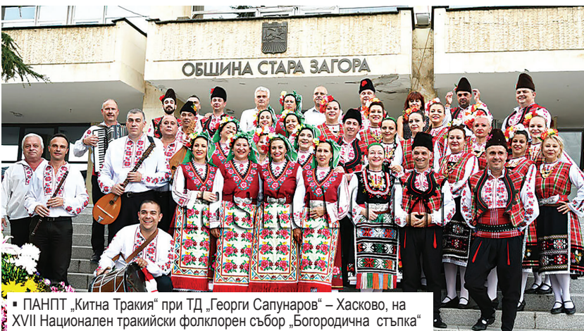
ПАНПТ „Китна Тракия“ при ТД „Георги Сапунаров“ – Хасково, на XVII Национален тракийски фолклорен събор „Богородична стъпка“