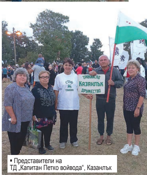
▪ Представители на ТД „Капитан Петко войвода“, Казанлък