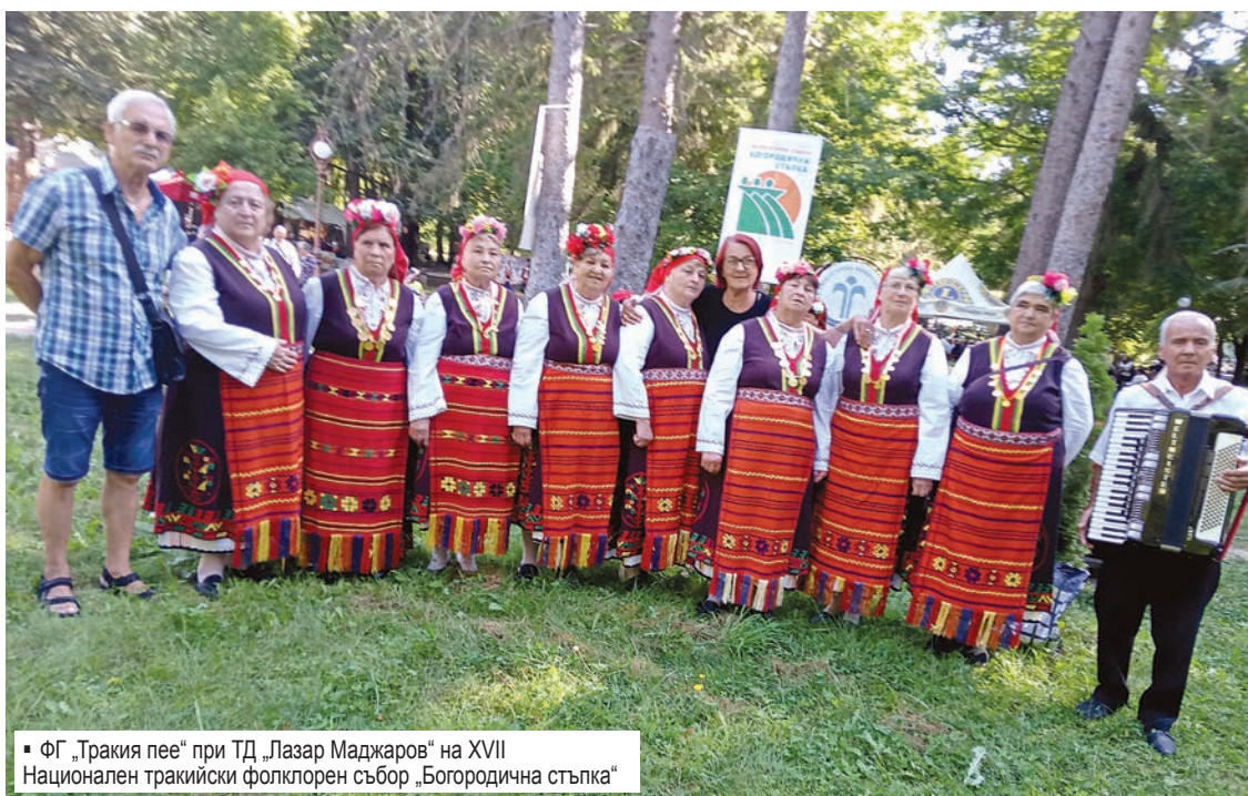
■ ФГ „Тракия пее“ при ТД „Лазар Маджаров“ на XVII Национален тракийски фолклорен събор „Богородична стъпка“

На двете сцени се сменяха певчески и танцови състави, инструменталисти и индивидуални изпълнители. На първи сцена председател е доц. д-р Валентина Райчева от Институт по етнология и фолклористика