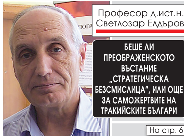
Професор д.ист.н. Светозар Елдъров

Печатно издание: ISSN 1313-7611 • Онлайн издание: ISSN 2815-2638