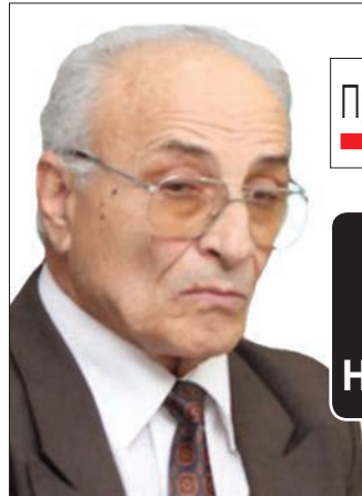
Проф. Делчо Порязов