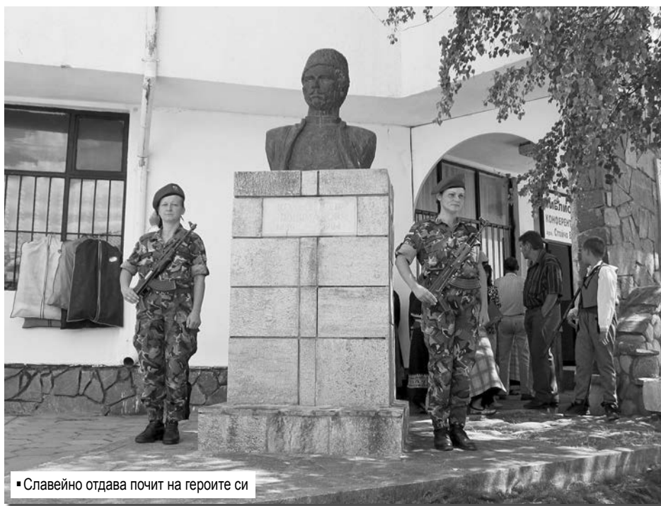
Славейно отдава почит на героите си

По-нататък се споменава, че: „Само коруджи Мехмет вероятно от тукашен наказателен отряд бил виснат на върба в центъра на Акбунар, че предал селото без съпротива“. Но явно местното българско население, макар изповядващо ислямска религия, не се е противопоставило на българската войска. Факт е, че запасните турски редици напускат бойното поле при Кърджали, отказвайки открито да участват в сражения с българската войска. Колкото до бесенето в с. Акбунар, то е извършено от башибозуци, установили се там по време на Междусъюзническата война, 1913 г.