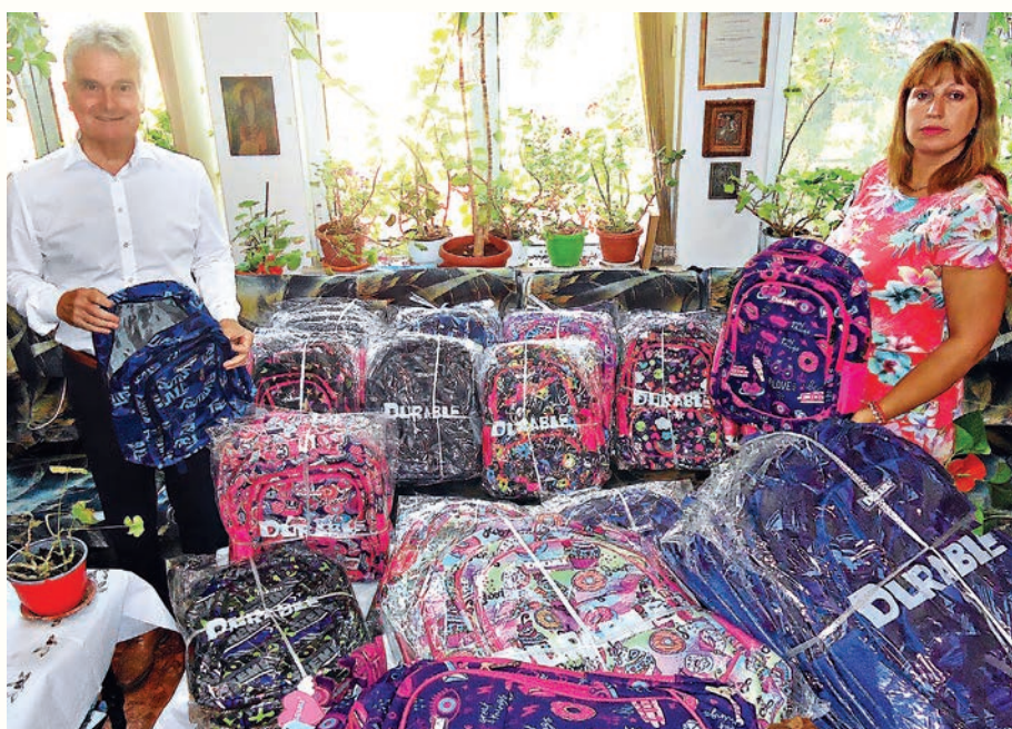
ЗЛАТКА МИХАЙЛОВА

Тракийското дружество „Георги Сапунаров“ и читалище „Тракия 2008“ в Хасково изпратиха поредната пратка за българското неделно училище „Св. св. Кирил и Методий“ в Истанбул. В навечерието на новата учебна година, която там започва на 16 септември,