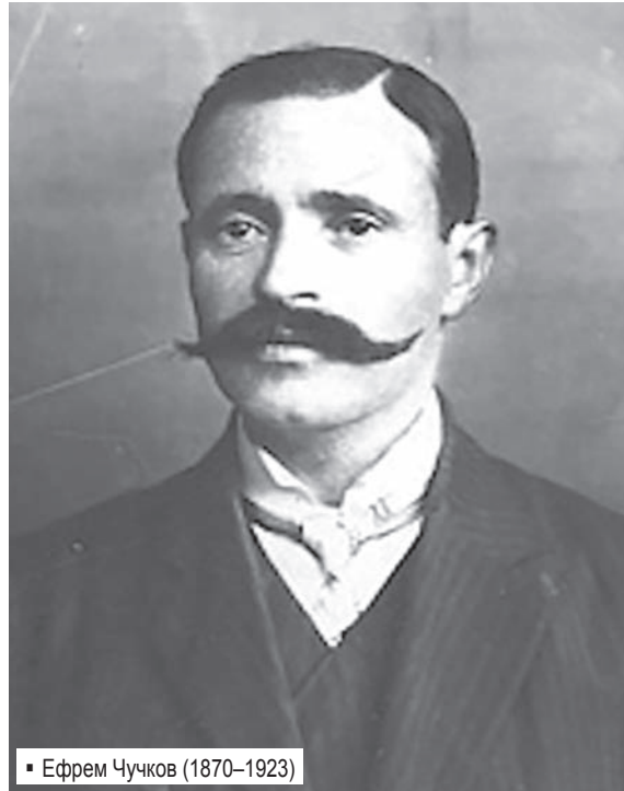
■ Ефрем Чучков (1870–1923)

От изключително важно значение, извън агитационните му и бойни акции като войвода на чета във вътрешността на Македония, са били и дейностите, координирани и извършвани от Ефрем Чучков за организиране, подготовка, окомплектоване, инструктиране и изпращане на четите от различните погранични пунктове на ВМОРО – най-вече от главния разпределителен център Кюстендил, но също и от други пунктове, включително например Лъджене (сега квартал на Велинград) и понякога от Дупница. Ръководел е и тайните канали за снабдяване на четите с оръжие от България. Тази денонощна координационна и организаторска работа на Чучков тогава е била направлявана предимно по писмен път от Гоце Делчев в качеството му на (фактически) първи ръководител на Организацията и неин основен задграничен