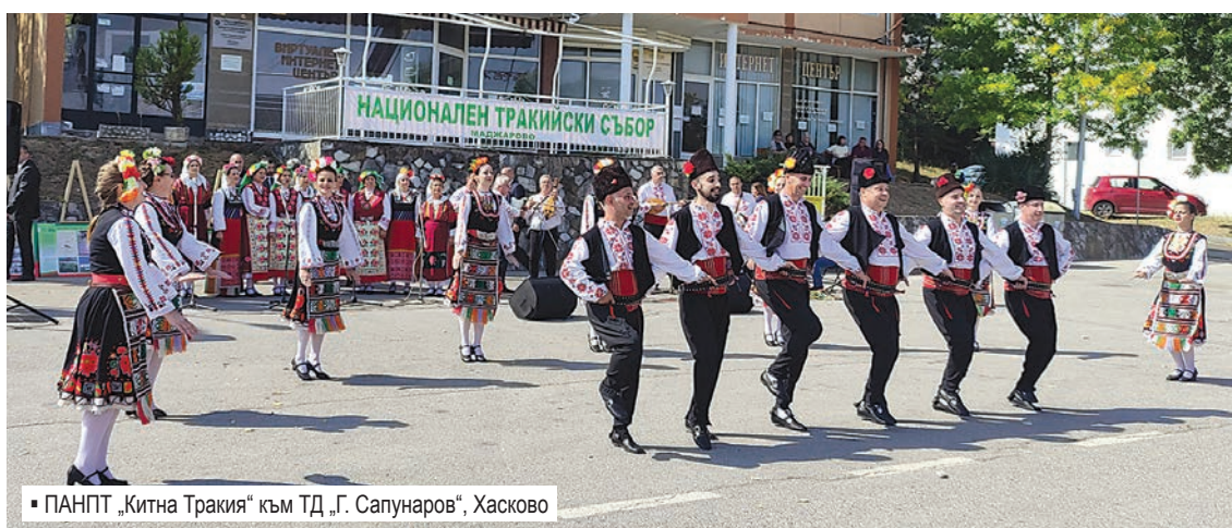
■ ПАНПТ „Китна Тракия“ към ТД „Г. Сапунаров“, Хасково