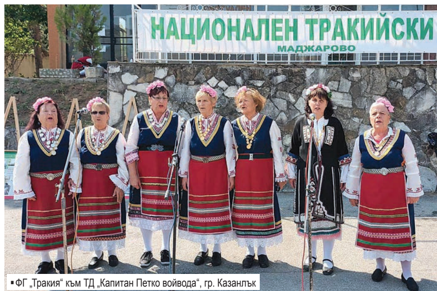
ФГ „Тракия“ към ТД „Капитан Петко войвода“, гр. Казанлък