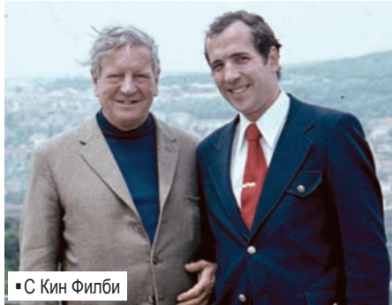
• С Ким Филби

ва умно, интересно и увлекателно. Освен знания, които дават за тайните операции, разузнаването и шпионажа, неговите книги ни запознават и с големи личности от тихия фронт“. Ето по-важните глави, някои от които са излизали освен на български на английски и руски език: „Разузнаването“, „Шпионажът като занаят“, „Разговори за разузнаването“, „Ким Филби – Шпионинът – Човекът“, „Тайните операции, които промениха света“, „Наръчник на шпионина“, първи и втори том, „Изповед на шпионина“, и „Маркус Волф – Човекът с лице“.