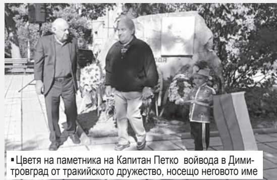
Цвета на паметника на Капитан Петко войвода в Димитровград от тракийското дружество, носещо неговото име