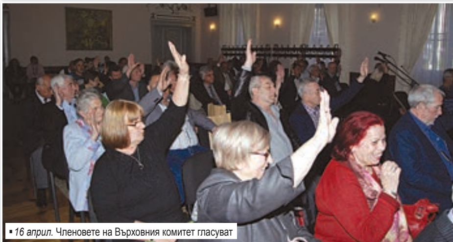
16 април. Членовете на Върховния комитет гласуват