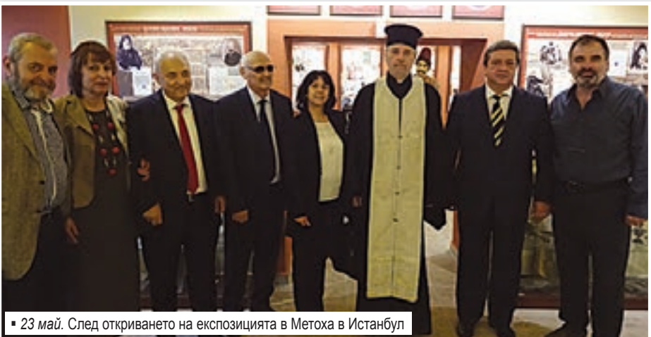
23 май. След откриването на експозицията в Метрох в Истанбул