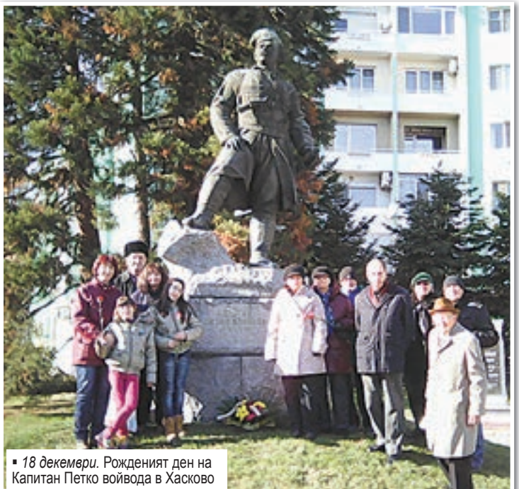
18 декември. Рожденият ден на Капитан Петко войвода в Хасково