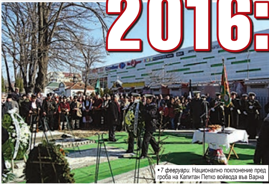
7 февруари. Национално поклонение пред гроба на Капитан Петко войвода във Варна