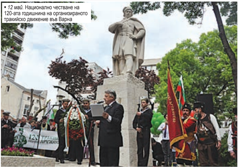
12 май. Национално честване на 120-ата годишнина на организираното тракийско движение във Варна