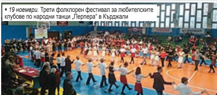
19 ноември. Трети фолклорен фестивал за любителските клубове по народни танци „Перпера“ в Кърджали