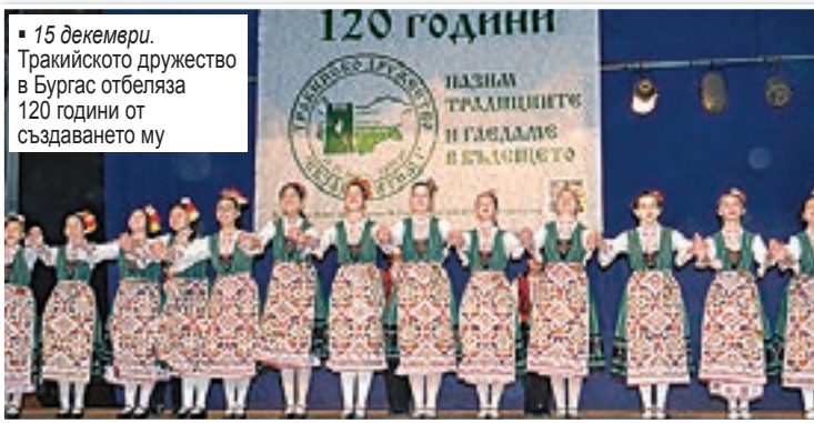
15 декември. Тракийското дружество в Бургас отбеляза 120 години от създаването му