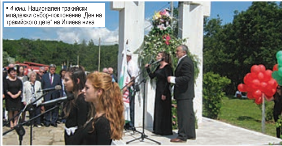
4 юни. Национален тракийски младежки събор-поклонение „Ден на тракийското дете“ на Илиева нива