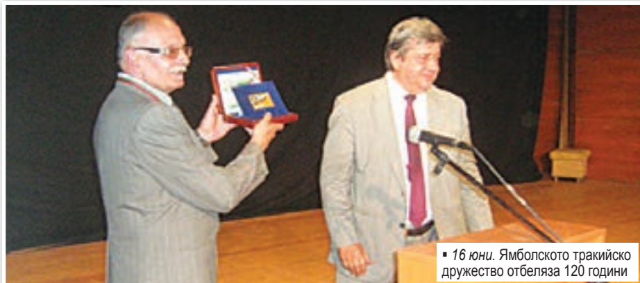
16 юни. Ямболското тракийско дружество отбеляза 120 години