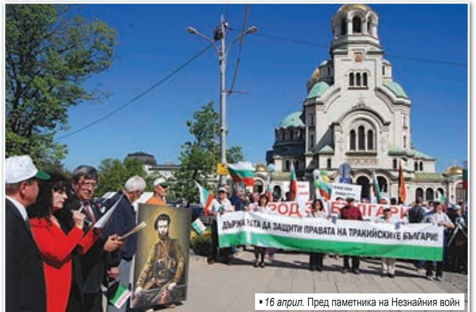
16 април. Пред паметника на Незнайния войн