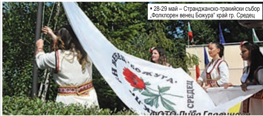
28-29 май – Странджанско-тракийски събор „Фолклорен венец Божура“ край гр. Средец