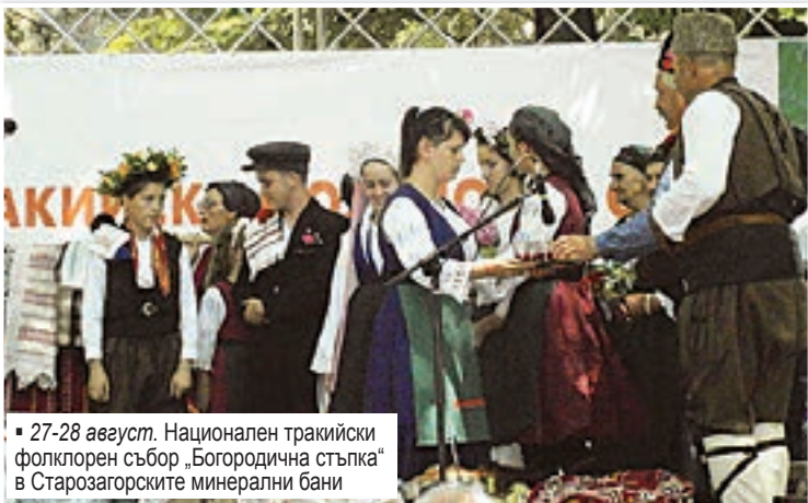
27-28 август. Национален тракийски фолклорен събор „Богородична стъпка“ в Старозагорските минерални бани