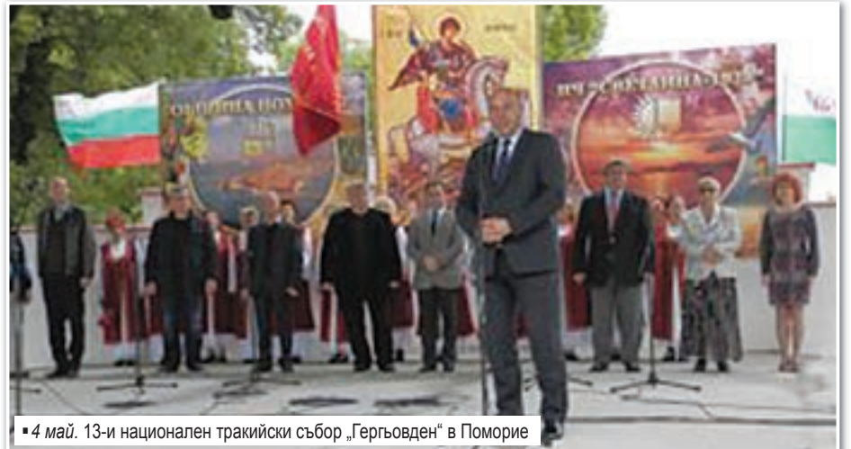
4 май. 13-и национален тракийски събор „Гергьовден“ в Поморие