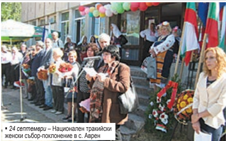
24 септември – Национален тракийски женски събор-поклонение в с. Аврен