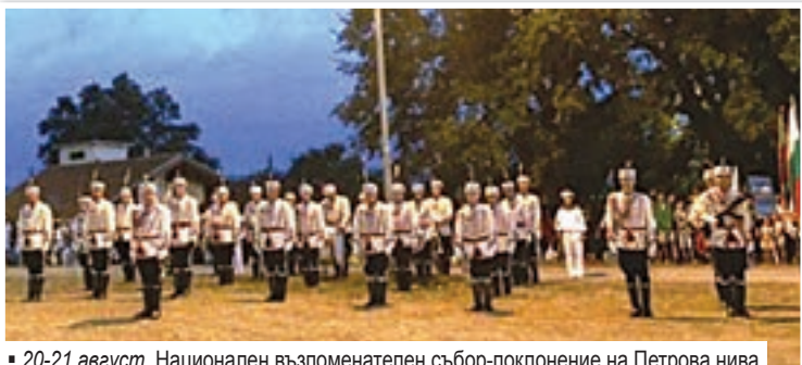
20-21 август. Национален възпоменателен събор-поклонение на Петрова нива