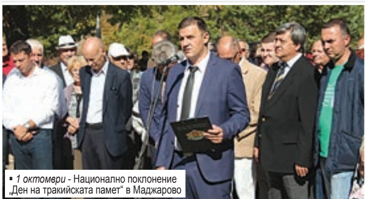
1 октомври - Национално поклонение „Ден на тракийската памет“ в Маджарово