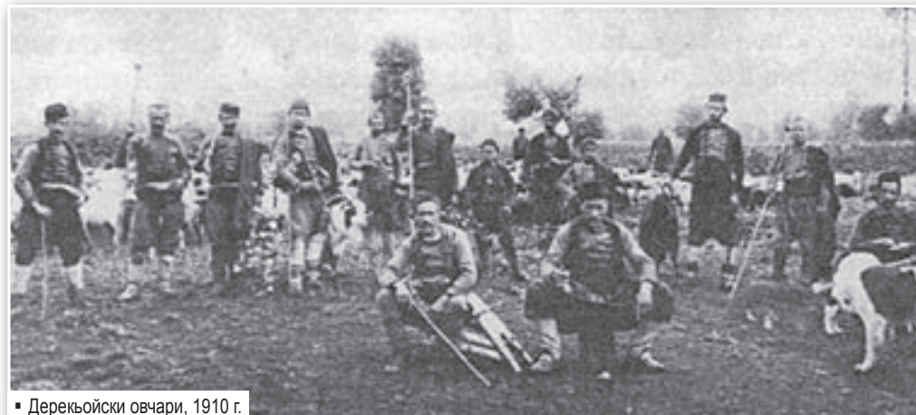
• Дерекôйски овчари, 1910 г.