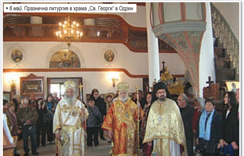
6 май. Празнична литургия в храма „Св. Георги“ в Одрин