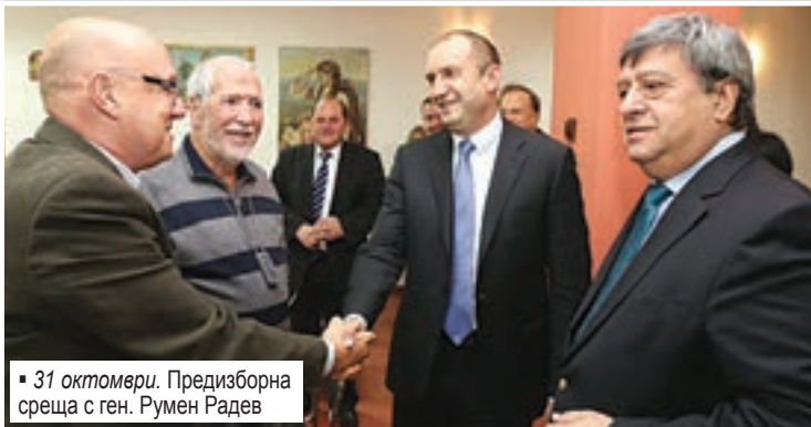
31 октомври. Предизборна среща с ген. Румен Радев