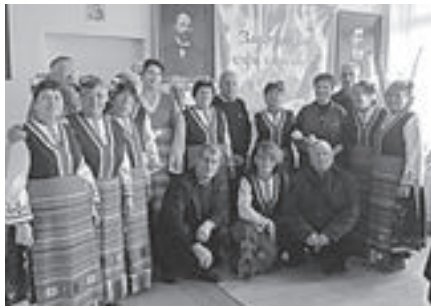
ми тракийски песни.

Фолклорния певчески състав „Тракия пес“ при дружеството огласи клуба с любими тракийски песни.