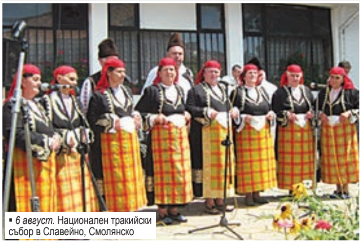
6 август. Национален тракийски събор в Славейно, Смолянско

23 декември. Почина именитият тракиец Делчо Балабанов, учен-изследовател на българо-турските отношения, юрския проблем и съдбата на тракийските бежанци.