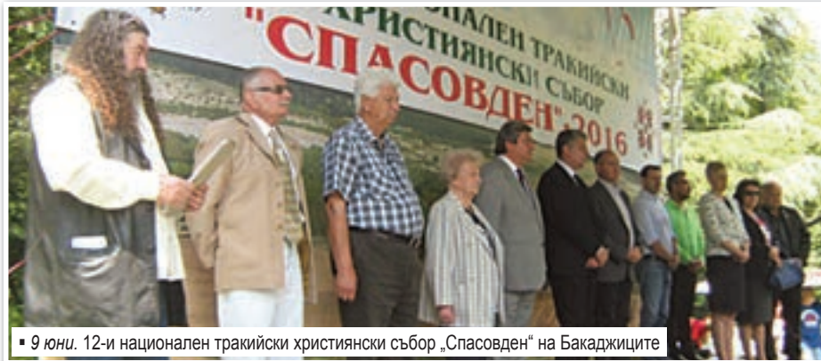
9 юни. 12-и национален тракийски християнски събор „Спасовден“ на Бакаджиците