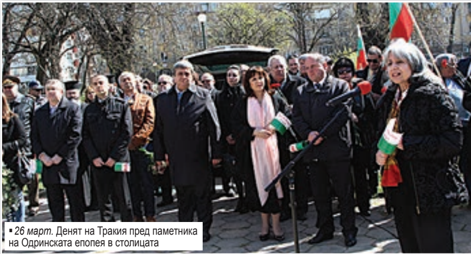
26 март. Денят на Тракия пред паметника на Одринската епопея в столицата