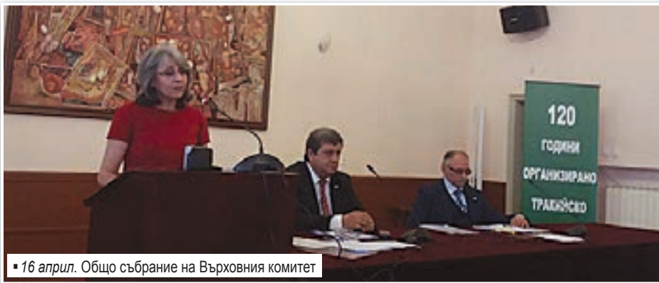
16 април. Общо събрание на Върховния комитет