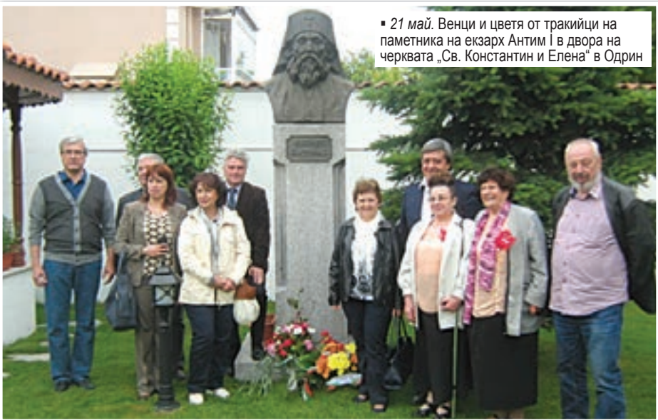
21 май. Венци и цветя от тракийци на паметника на екзарх Антим I в двора на черквата „Св. Константин и Елена“ в Одрин