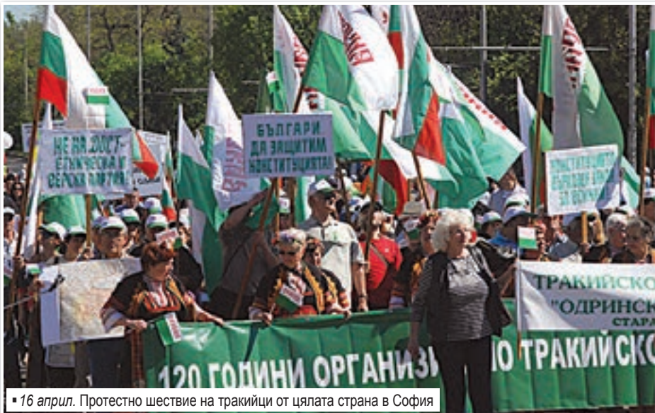
16 април. Протестно шествие на тракийци от цялата страна в София