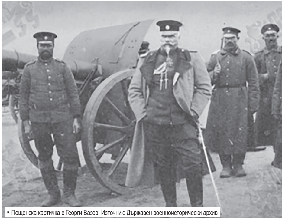
■ Пощенска картичка с Георги Вазов.

Вторият важен документ с регламентираща стойност, при функционирането на