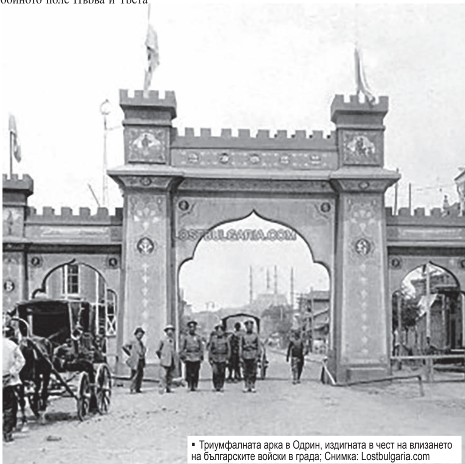
• Триумфалната арка в Одрин, издигната в чест на влизането на българските войски в града; Снимка: Lostbulgaria.com