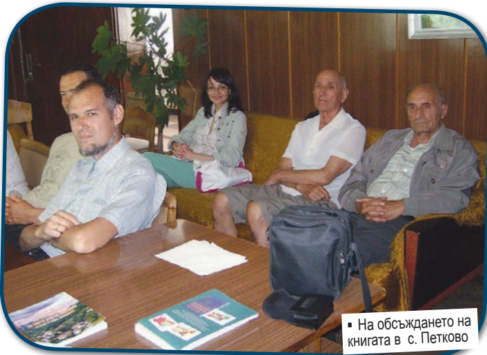
На обсъждането на книгата в с. Петково

Една местна история за лична мома, отвлечена от хорото от друговец и посегнала на живота си, за да не промени вярата си, е дълбоко залегнала в паметта на жителите на среднородопското село Петково. Тя е в основата на книгата на Георги Митринов, разгледана в ракурса на песенната фиксация на разказа. Повече от две столетия събитието „живее“ в песенни варианти, опасно от забравата. Превърнато се е в героичен разказ на границата между фолклора и историята. Историческият факт неведнъж подбужда създаването на песни във фолклора, но и песните са в състояние да превърнат епизод от живота на една човешка общност в значима част от тяхната местна история. За петковци песента и преданието за Злата Зенгин Милкова не са само наследено фолклорно знание. Разказът за нея в нашата съвременност е материализиран в два паметника, на единия от които е изсечен откъс от песента. така историята придобива трайност и сила с различни изразни средства.