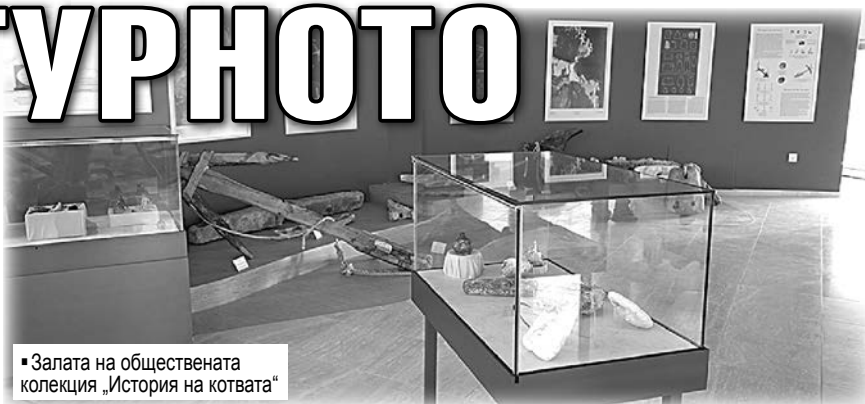
Залата на обществената колекция „История на котвата“

Д-Р АТАНАС ОРАЧЕВ, ПРЕДСЕДАТЕЛ НА НАУЧНИЯ СЪВЕТ НА СДРУЖЕНИЕ „ЧЕРНОМОРСКА СТРАНДЖА“