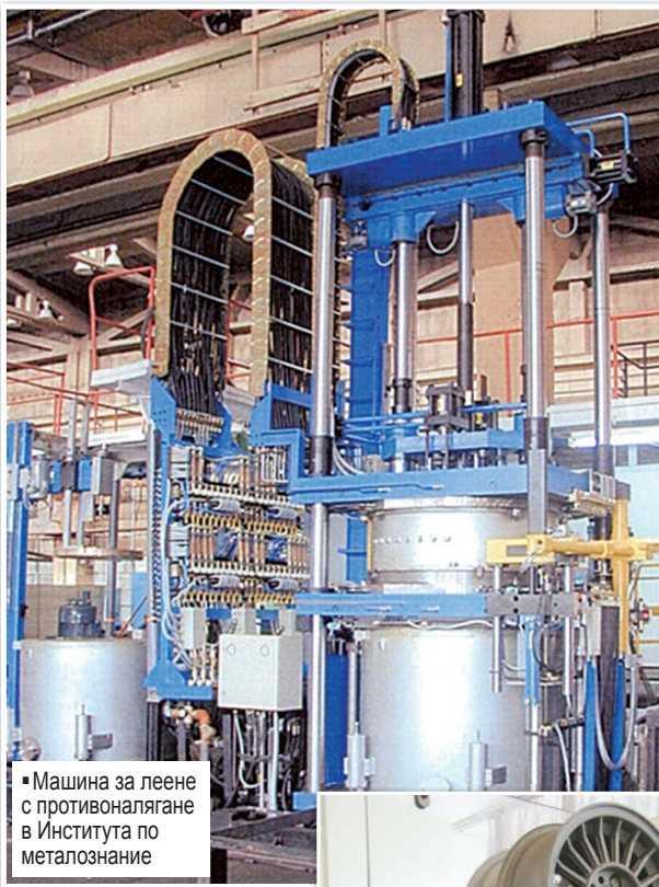
■ Машини за леене с противоналягане в Института по металознание