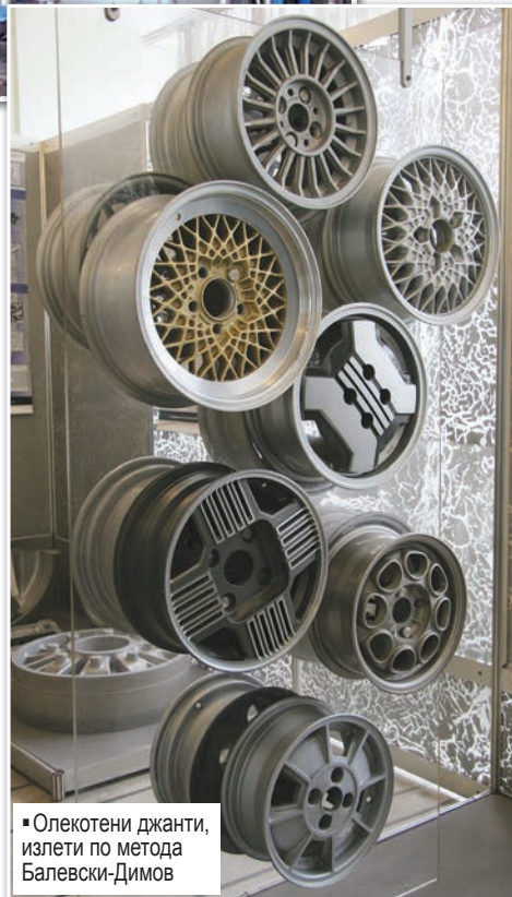
■ Олекотени джанти, излети по метода Балеvски-Димов

„Методът Балеvски-Димов“ е забележителен принос към металознанието и металообработването, той е научна и технологична новост в световната леярска техника и дава възможност за производство на отливки от леки сплави с голяма точност и високи технически показатели, създава нови условия за обработване на металните стопилки с газове и открива големи практически възможности за производство на нови сплави. „Наука – практика – произ-