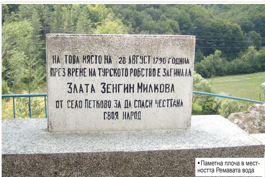
Паметна плоча в местността Ремавата вода