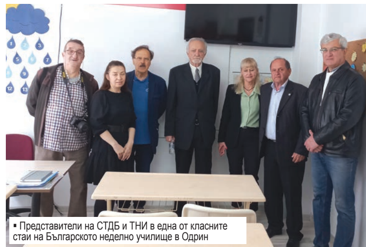
Представители на СТДБ и ТНИ в една от класните стаи на Българското неделно училище в Одрин