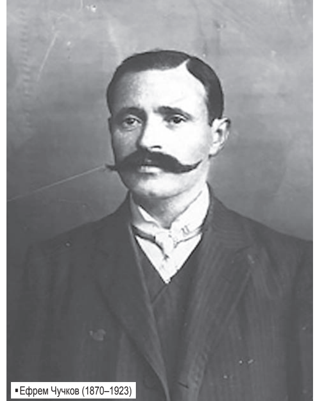
■ Ефрем Чучков (1870–1923)

Ефрем Чучков, известен като „Практикът на Организацията“ и „Дясната ръка на Гоце Делчев“, е бил един от ръководителите на ВМОРО/ВМРО до смъртта си през 1923 година.