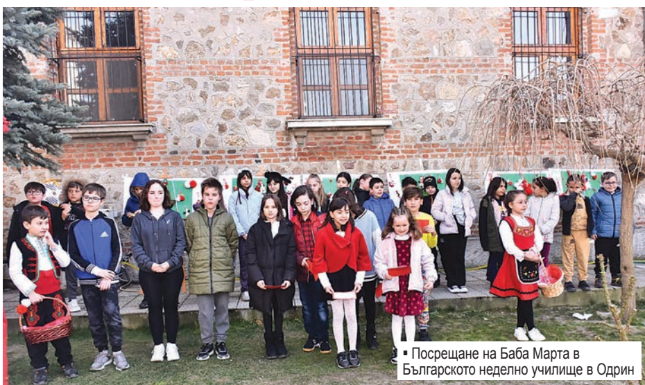
▪ Посрещане на Баба Марта в Българското неделно училище в Одрин

Занятията на Българското неделно училище в гр. Одрин се провеждат в помещението на читалище „Просвета – 1870“, което е филиал на едноименното читалище в гр. Свиленград. То се помещава в двора на българската църква „Свети Великомъченик Георги“ и се ръководи от Мария Чъкърък, която ра-