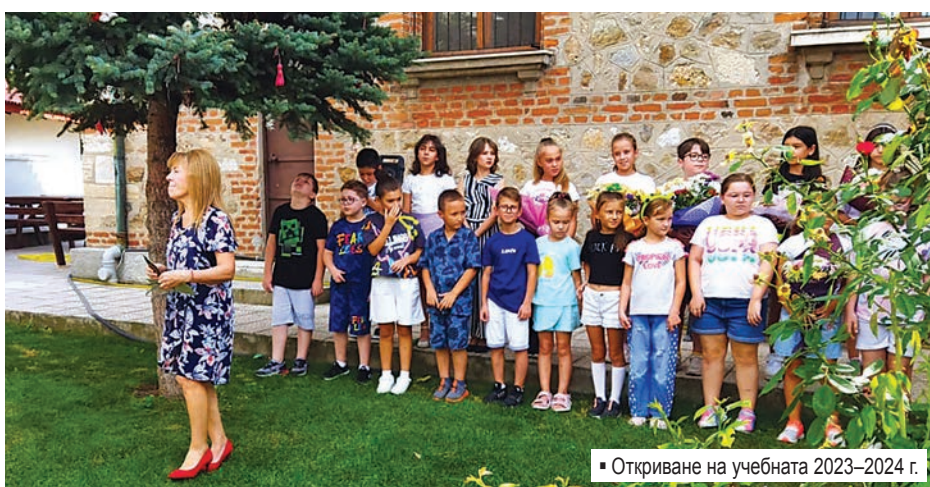
▪ Откриване на учебната 2023–2024 г.

боти всеотдайно за поддържане огъня на знанието, за обогатяването на духовния и културен живот, за съхраняване и развиване на българските традиции и обичаи. След 2022 година поради увеличени брой ученици,