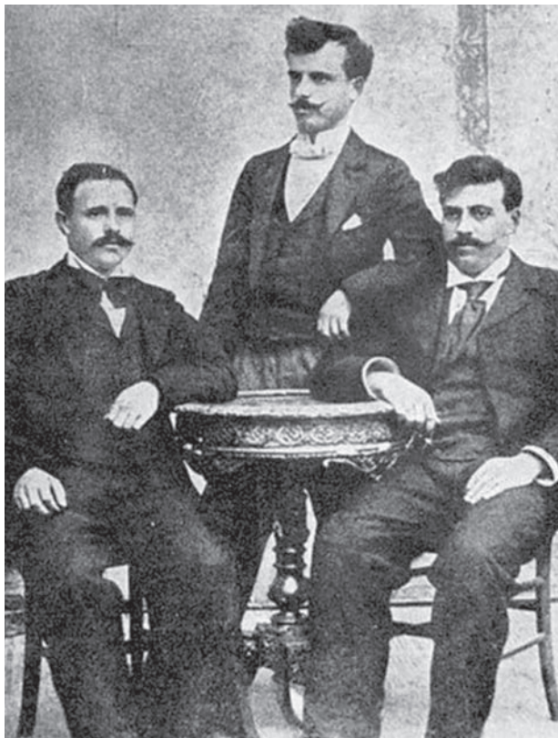
■ Ефрем Чучков и Гоце Делчев (седнали), и Климент Шапкарев (София, 1901 г.)

учебници по история на индийни и информационни формация за революционното дело на Ефрем Чучков; осъществяване на международно информационно равнище за повишаване на обществената осведоменост