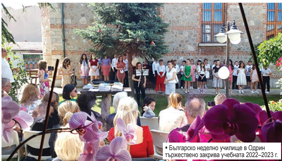
▪ Българско неделно училище в Одрин тържествено закрива учебната 2022–2023 г.