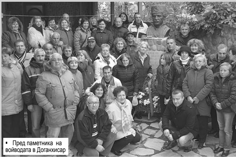
• Пред паметника на войводата в Доганхисар