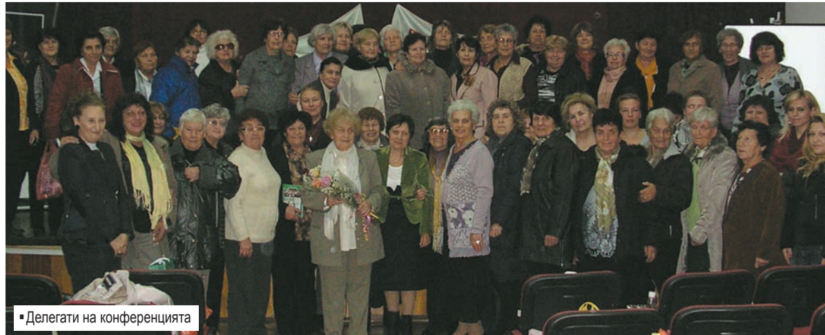
Делегати на конференцията