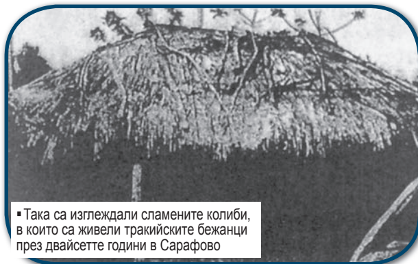
Така са изглеждали спалените колиби, в които са живели тракийските бежанци през двайсетте години в Сарафово

СМЪРТТА НАСТИГНА инж. Стоимен Сарафов във Виена на 3 септември 1931 г. Пет месеца преди това заселището Папарос бе признато официално с царски указ за село. Преминуването му фактически е станало на 17 ноември 1929 г. в присъствието на инж. Сарафов, който принципно бил дал съгласието си. На този ден бежанците „освещават“ новото селище и го „кръщават“ на инж. Стоимен Сарафов в знак на признателност за усилията му за настаняване и подобряване живота на прокудените 108 семейства от с. Пишманкьой, Малгарско, 34 – от с. Ениджия, Лозенградско и 6 семейства от Каваклия, Лозенградско. На погребението му в София учителят Георги Казаков казал, че „съзлите на бежанците никога няма да спрат, защото родителите и децата от Сарафово дължат своето спасение на инженер Стоимен Сарафов“. Преди двадесет години Сарафово бе слято с Бургас, а днес успешно се развива като един от кварталите на града. Дълг на тракийските потомци е да помнят и да не забравят името на благодетелния българин!