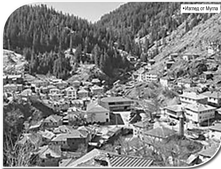
• Изглед от Мугла

В този смисъл Родопите са планина, която не разделя, а събира. Брат с брата. Кръв с кръвта. Родопите са предел, който всеки българин трябва да премине, за да намери себе си и другите: и българинът мохамеданин, и българинът християнин; и българинът будист, и българинът юдаист, и българинът сектант, и българинът езичник. Да не говорим за атеистите. Не го ли премине, остава при заблудата и греха, при невежеството и мрака.