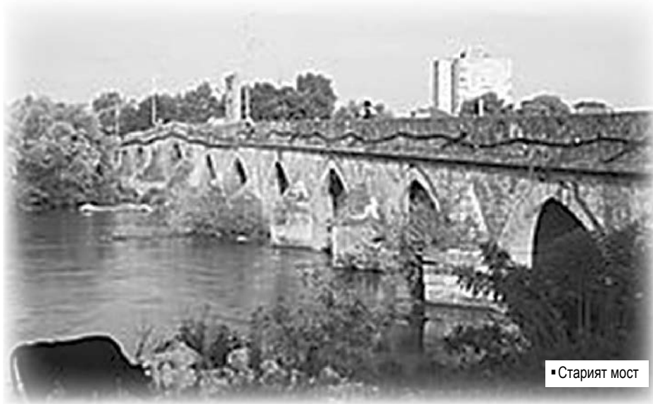
• Старият мост