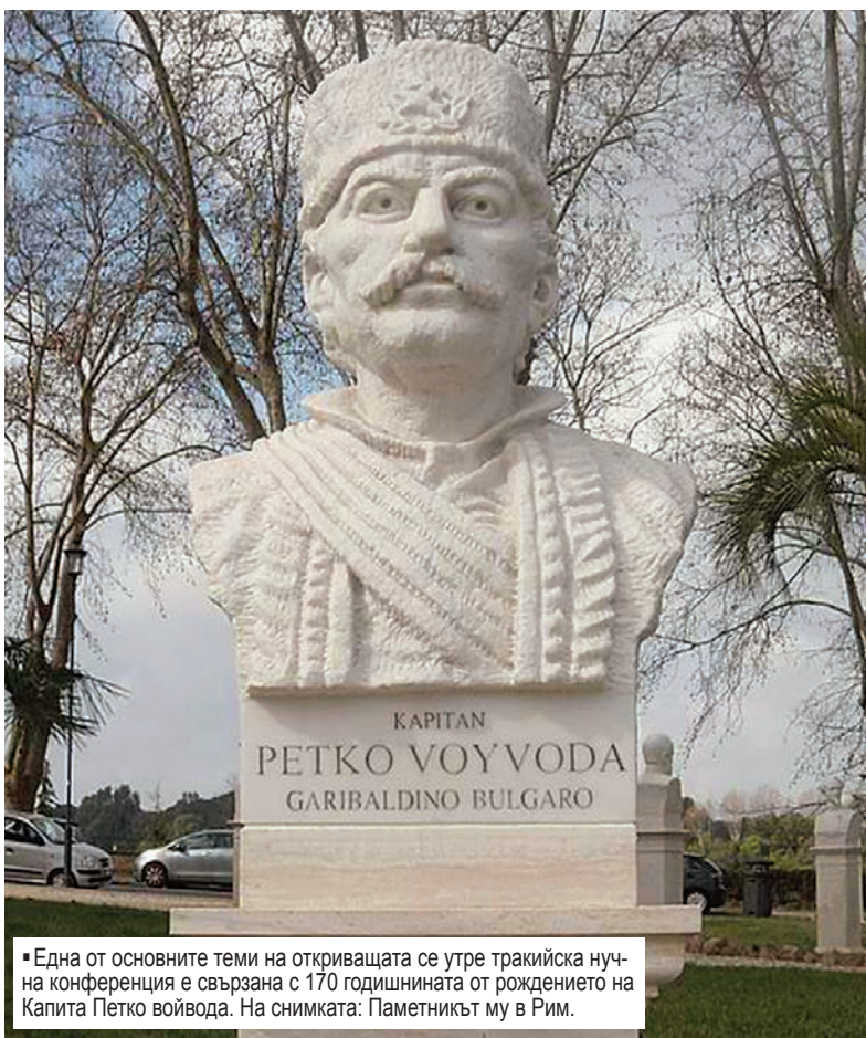
Една от основните теми на откриващата се утре тракийска научна конференция е свързана с 170 годишнината от рождението на Капитан Петко войвода. На снимката: Паметникът му в Рим.