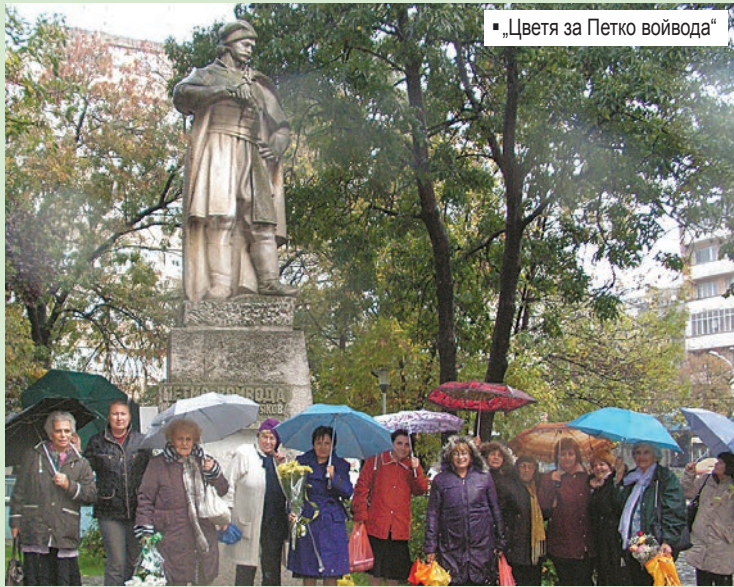
„Цвета за Петко войвода“