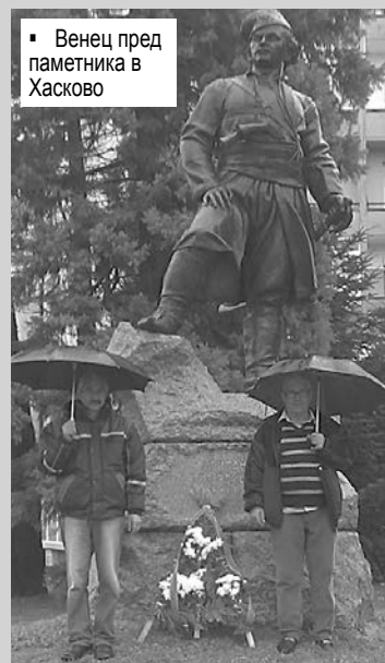
• Венец пред паметника в Хасково

гато дедите ни са го обитавали, се е наричал Дедеагач, карнобатлии се разходиха по беломорския бряг и из града, където някои посетиха местната църква и запалиха свещ с молитва към Св. Димитър, чийто празник православните християни празнуваха в този ден.