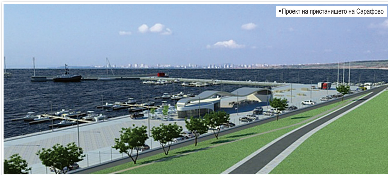
Проект на пристанището на Сарафово