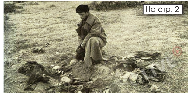
На стр. 2

141 ГОДИНИ ОТ РОЖДЕНИЕТО НА ДИМИТЪР МАДЖАРОВ