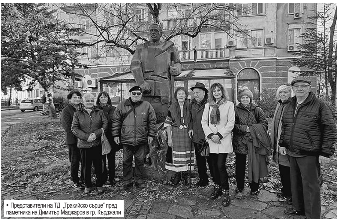
▪ Представители на ТД „Тракийско сърце“ пред паметника на Димитър Маджаров в гр. Кърджали

На 28 септември Димитър Маджаров събира старейшините и решава да поведе колоната с бежанци към България. Два дни след това нощуват на връх Коджаеле, където вали сняг. Там, уморени и премръзнали, загиват над 100 души. Похо-