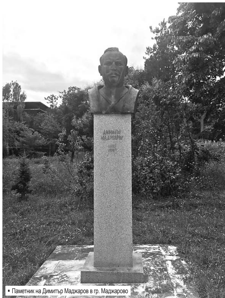
▪ Паметник на Димитър Маджаров в гр. Маджарово

Тракийският войвода умира на 25 ноември 1949 г. в Кърджали. Но остава в паметта на българите като „спасител на тракийските бежанци“. Градът край р. Арда, станал свидетел на кървавата 1913-а, е преименуван в Маджарово в чест на Войводата. Признателните потомци са издигнали негови паметници в центъра на Маджарово и Кърджали.