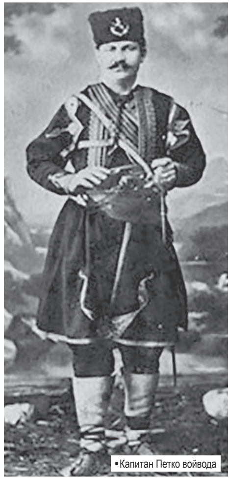
• Капитан Петко войвода

Руските войски минали Балкана. Турците събрали всичките си войскове части и от Беломорието и ги пратили да се бият срещу тях. Генерал Гурко превзел Ст. Загора. Срещу него бил изпратен от Черна гора в Тра-