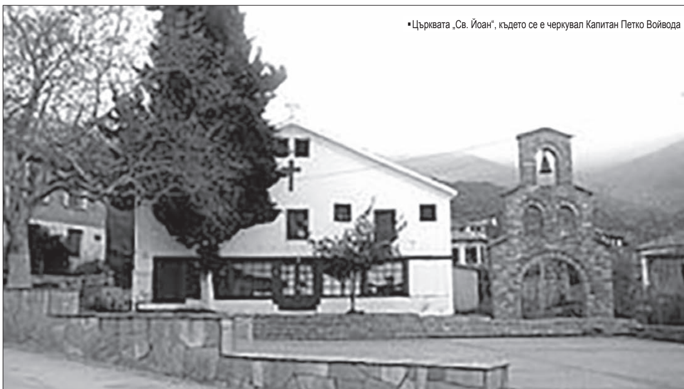
• Църквата „Св. Йоан“, където се е черкувал Капитан Петко Войвода