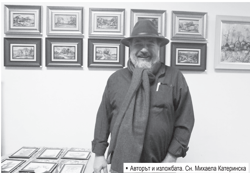
Авторът и изложбата.