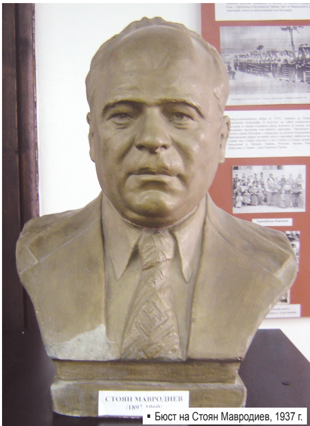
Бюст на Стоян Мавродиев, 1937 г.