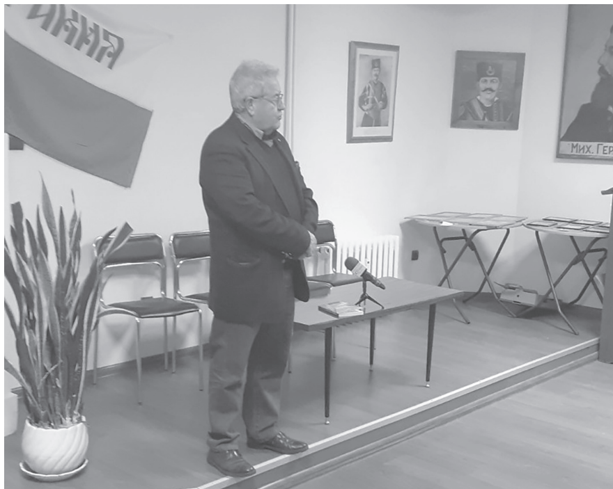
Продължение от 5-а стр.

Още повече, че при тогавашната техника 125 000–130 000 тираж не може да се отпечата така бързо.