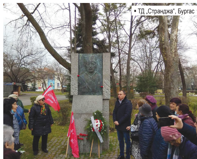
▪ ТД „Странджа“, Бургас