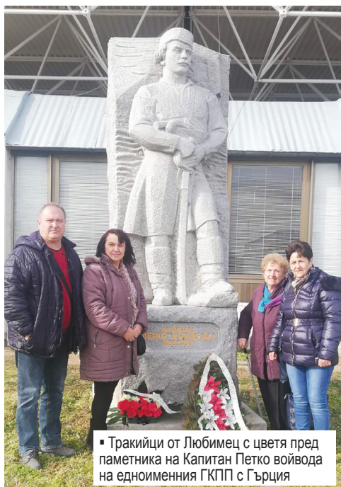
▪ Тракийци от Любимец с цветя пред паметника на Капитан Петко войвода на едноименния ГКПП с Гърция