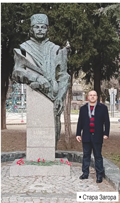
▪ Стара Загора