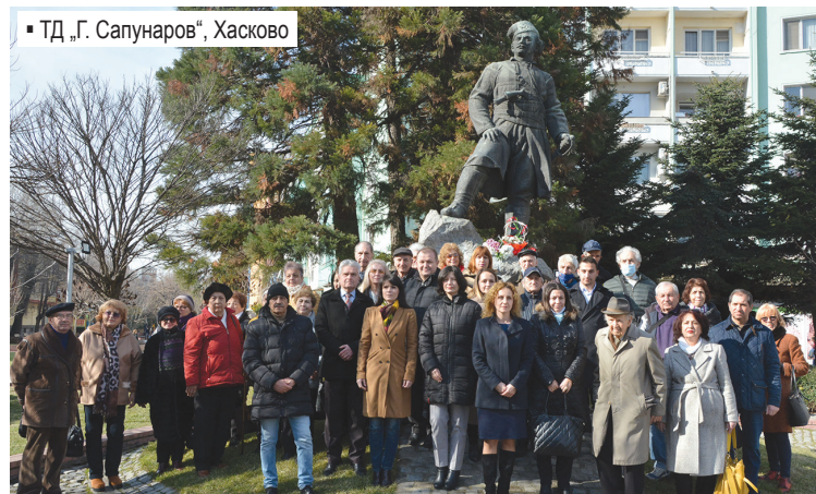
▪ ТД „Г. Сапунаров“, Хасково