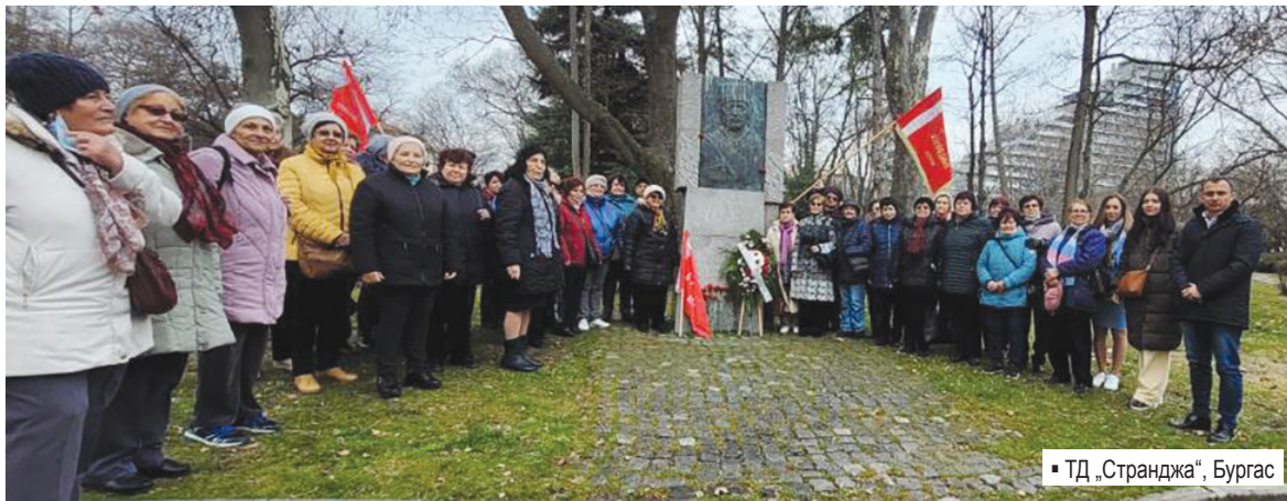
▪ ТД „Странджа“, Бургас