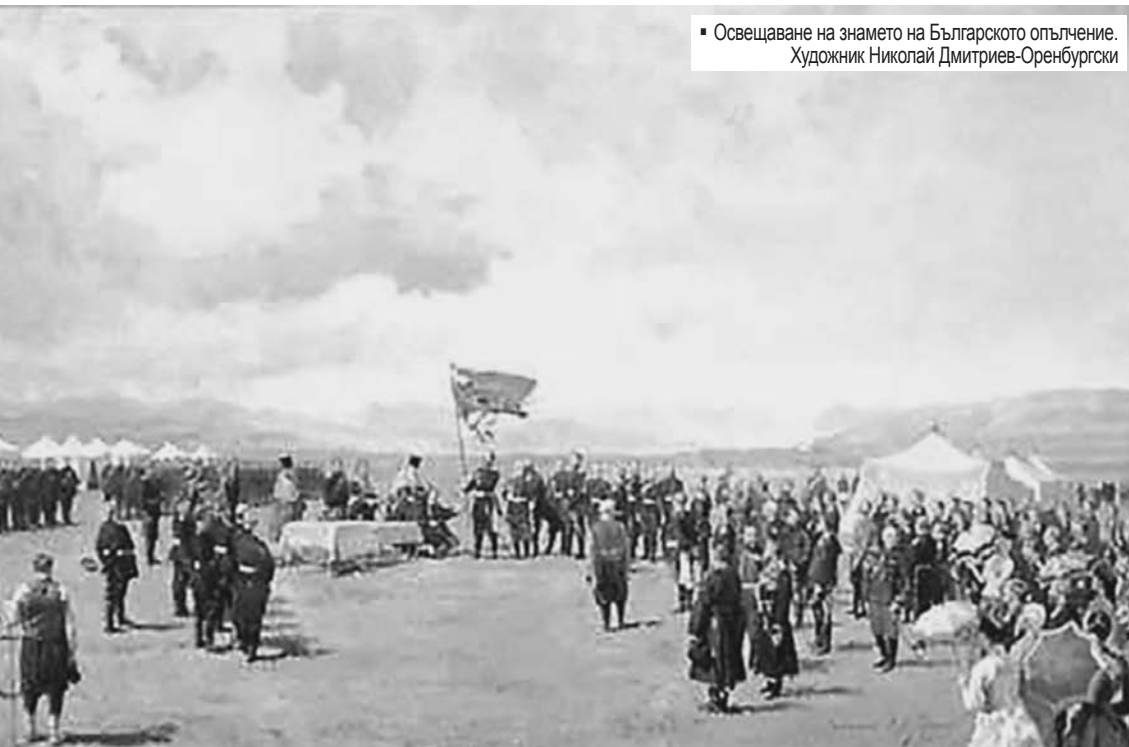
■ Освещаване на знамето на Българското опълчение. Художник Николай Дмитриев-Оренбургски

Така, че всичките тези приказки, всичките тези съмнения и конюнктурни деформации не казват простата, великата истина, че една