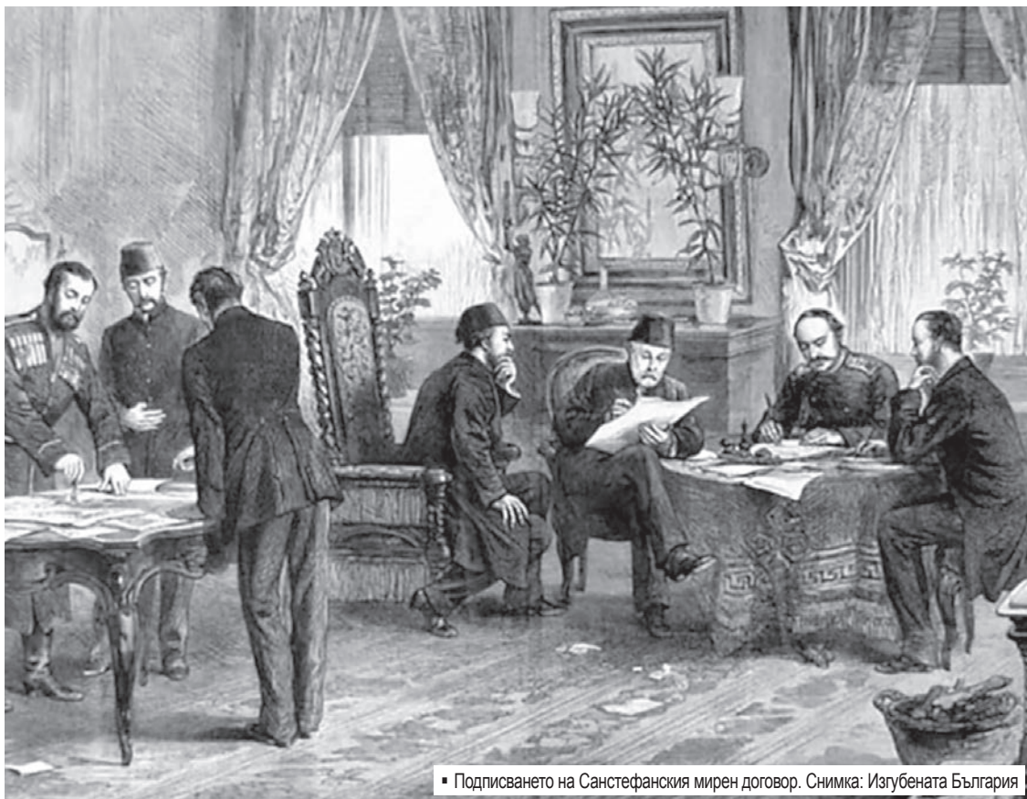
Подписването на Санстефанския мирен договор.