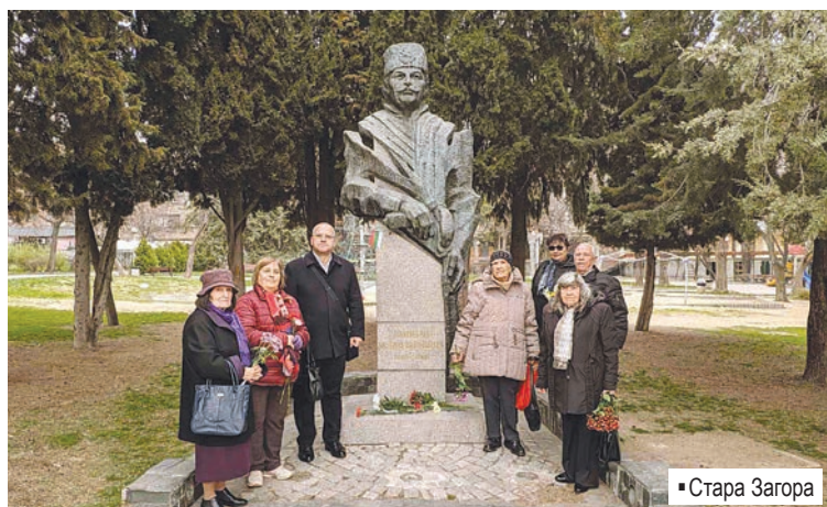
▪ Стара Загора