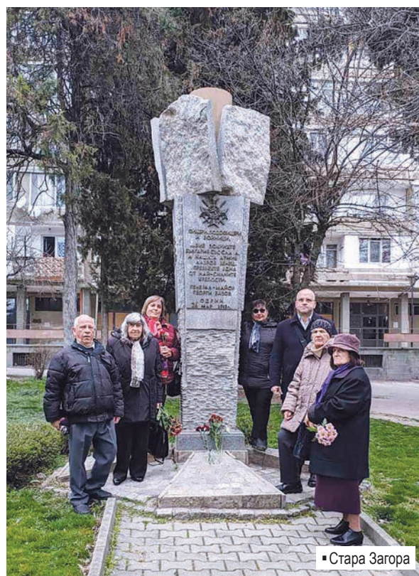
▪ Стара Загора