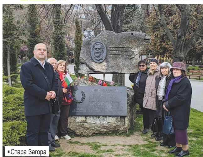
▪ Стара Загора