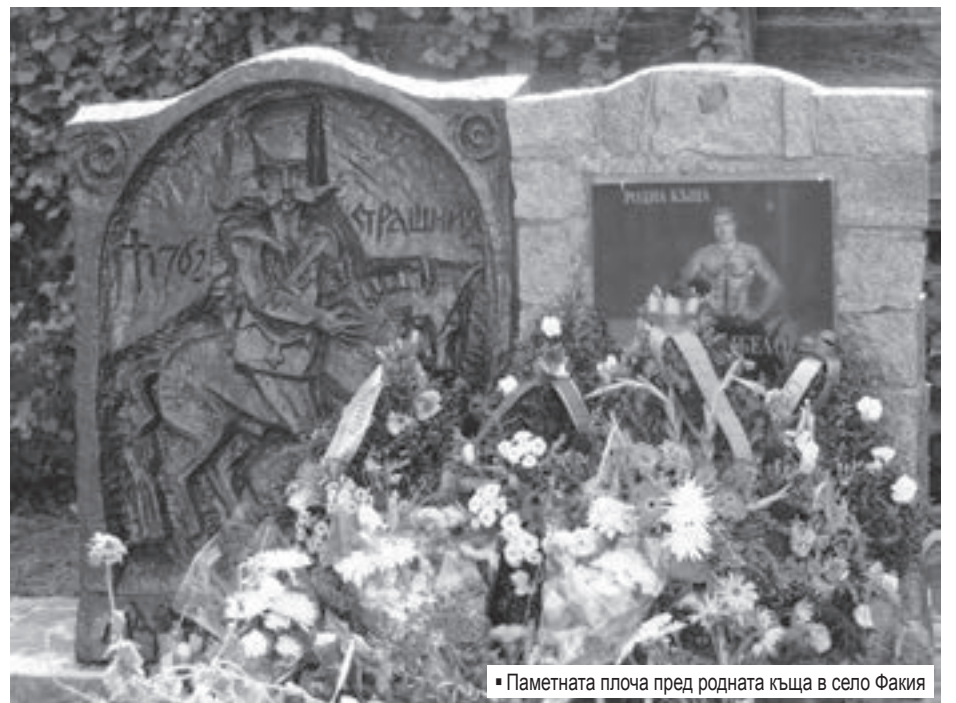
Паметната плоча пред родната къща в село Факия