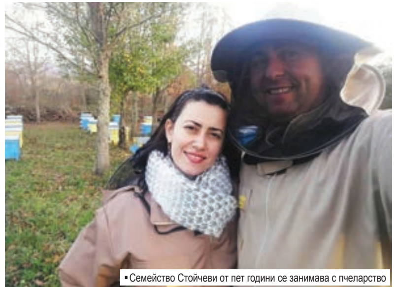
■ Семейство Стойчеви от пет години се занимава с пчеларство

До средата на 2019 г. това ще бъде първият български регистриран продукт със защитено наименование за произход