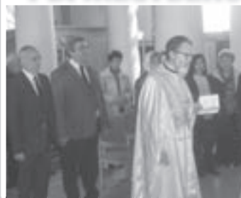
Продължение от 1-а стр.

Дълг е на тракийци и на тракийската организация да разкриват истината както за славната победа и чувовния подвиг при Одрин, така и за трагедията на тракийци, жертва на първия геноцид на XX век, в който 76 хиляди са убити, а 350 хиляди са били прогонени от родните си огнища. Той изтъкна, че дейността на Съюза все повече се насочва към младите, които трябва да приемат като своя тракийската кауза, която е национална общобългарска кауза. Към това ще бъде насочено и честването на 175-ата годишнина от рождението на