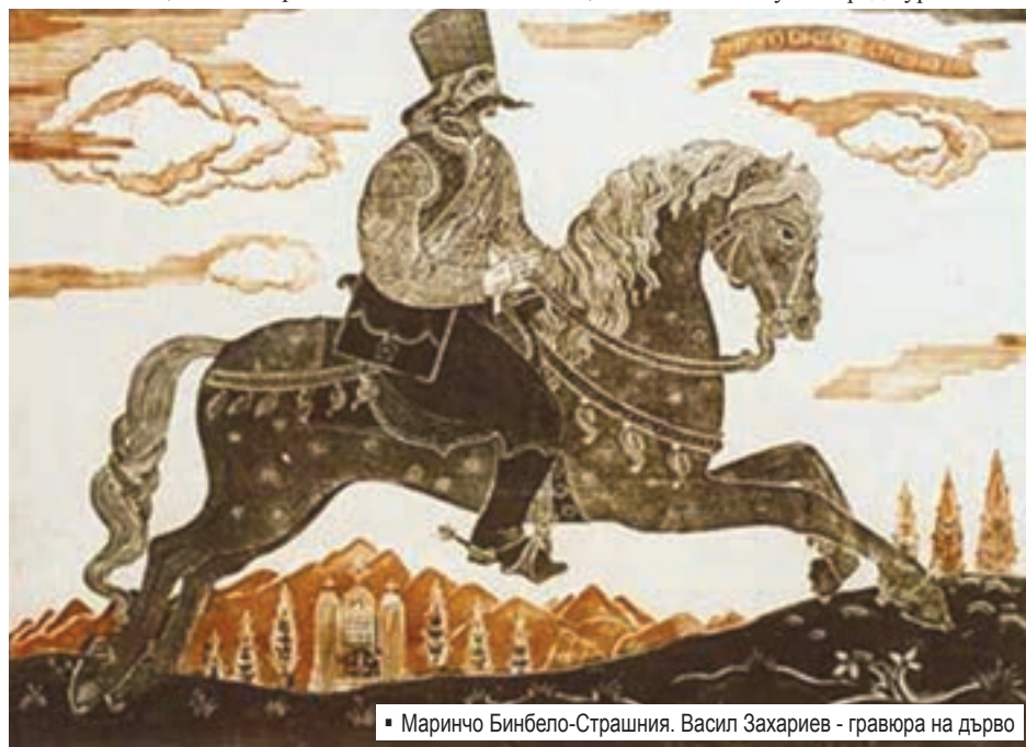
▪ Маринчо Бинбело-Страшния. Васил Захариев - гравюра на дърво

Популярни сред рода са имената Пейчо, Стоян, Нико, Вълко. Например името Пейчо е носено от няколко представители на Бинбелови – от Пейчо Овчаря, от Дели Пейчо, от Пейчо Шейтана. Първоначалното име на рода е Белени (Белови), но от края на XVII – началото на XVIII в. се утвърждава името Бинбелови, дадено