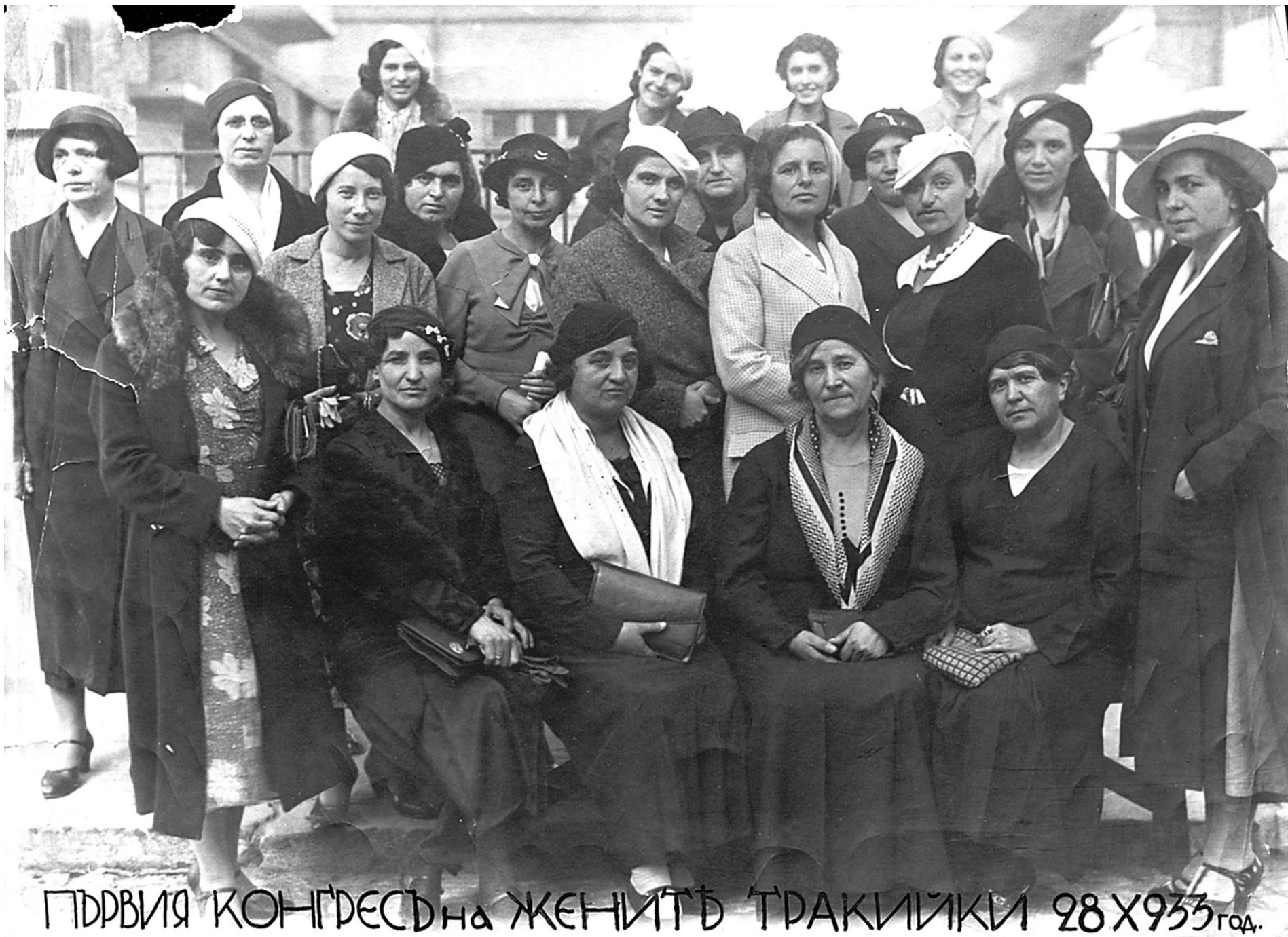
ПЪРВИЯ КОНГРЕСЪТ НА ЖЕНИТЕ ТРАКИЙКИ 28 X 1933 год.