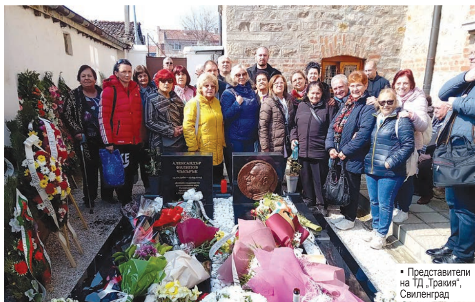
▪ Представители на ТД „Тракия“, Свиленград