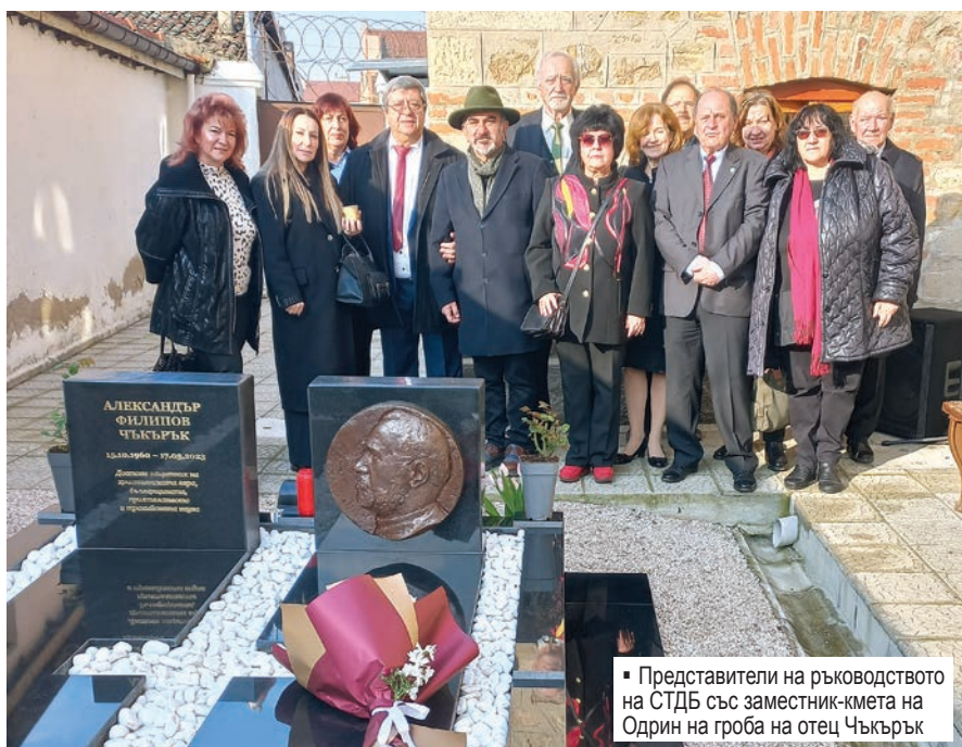
▪ Представители на ръководството на СТДБ със заместник-кмета на Одрин на гроба на отец Чъкърък