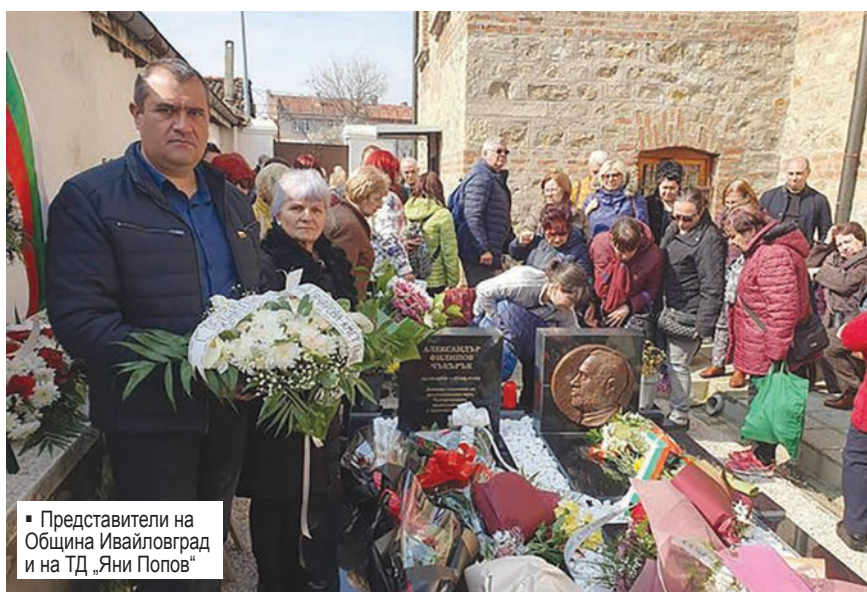
▪ Представители на Община Ивайловград и на ТД „Яни Попов“