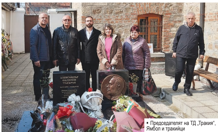
▪ Председателят на ТД „Тракия“, Ямбол и тракийци