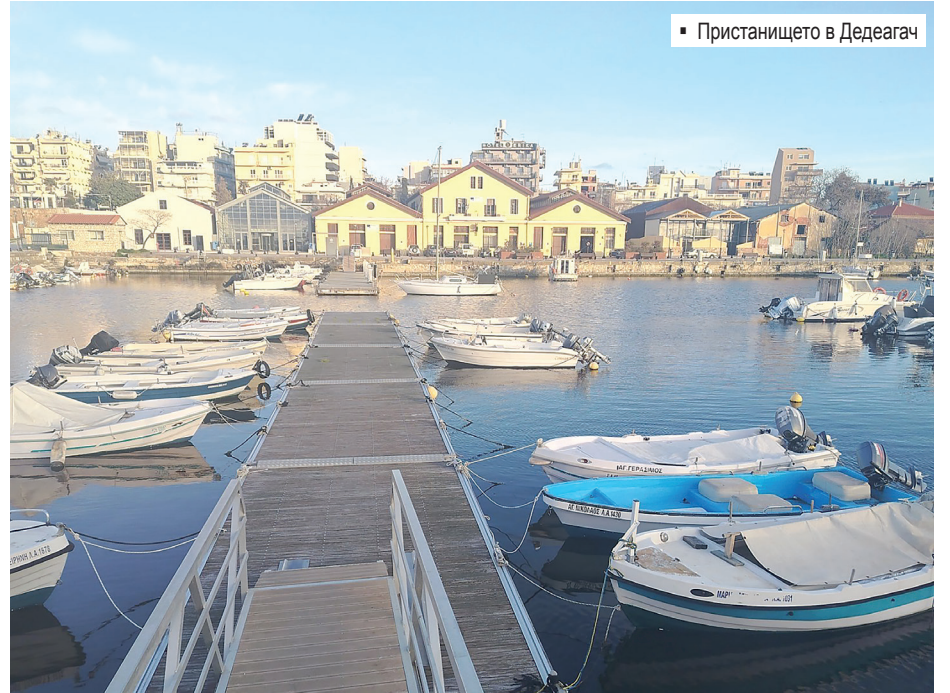
▪ Пристанището в Дедеагач