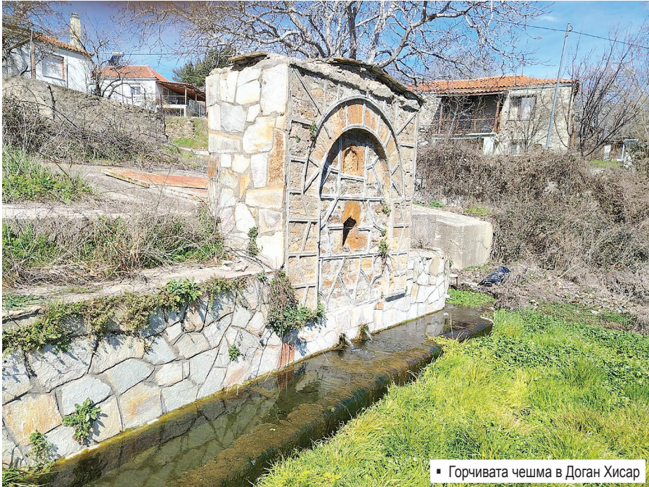
▪ Горчивата чешма в Доган Хисар