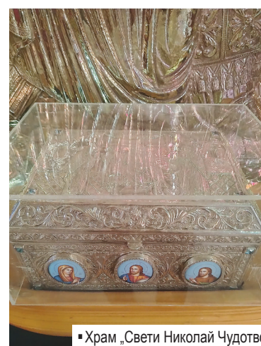
▪ Храм „Свети Николай Чудотворец“ в Дедеагач