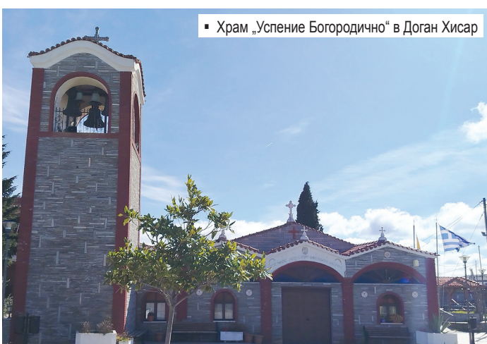
▪ Храм „Успение Богородично“ в Доган Хисар