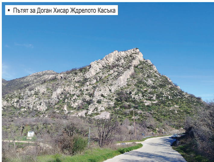
▪ Пътят за Доган Хисар Ждрелото Касъка