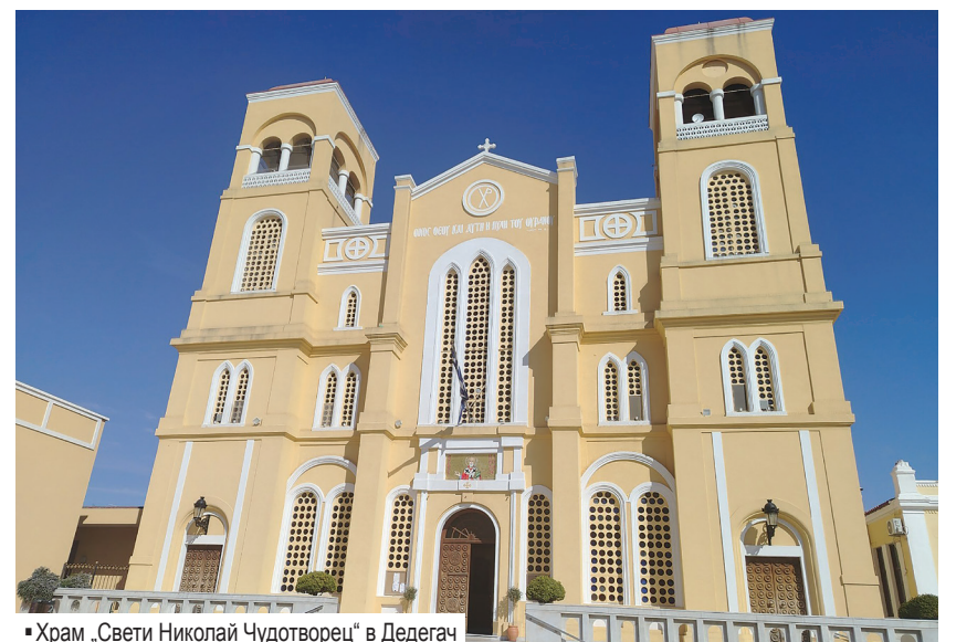
▪ Храм „Свети Николай Чудотворец“ в Дедеагач