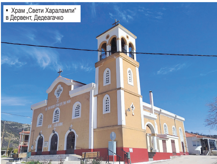
▪ Храм „Свети Харалампи“ в Дервент, Дедеагачко