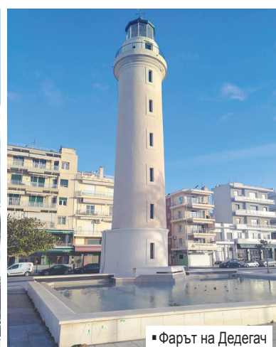
▪ Фарът на Дедеагач