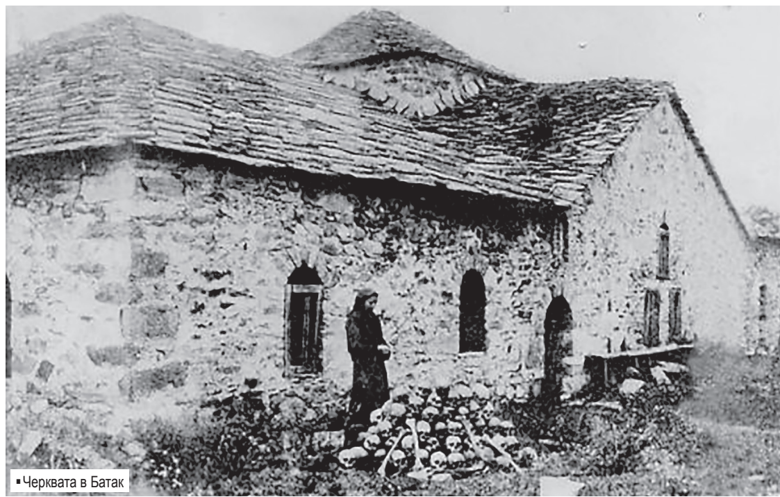
■ Черквата в Батак

бяха завърнали у дома, възползвайки се от нашето посещение или това на г. Беринг. Те са могли да се завърнат много по-рано, но ужасът е бил толкова голям, че без присъствието и покровителството на чужденец, те не са посмели да сторят това. Сега те ще продължават с часове да оплакват своите опепелени домове с тази странна погребална песен. Това беше обяснението на извиващия се вой, който бяхме чули горе на хълма. Колкото повече напредвахме, толкова повече плачът се увеличаваше. Някои от жените бяха седнали на купчините камъни, срутени върху поделите на къщите им. Други ходеха нагоре-надолу пред портите, кършеха ръце и повтаряха същите вопли на отчаяние. Малко сълзи имаше в тази всеобща скръб. Това беше суха, тежка, отчаяна скръб.