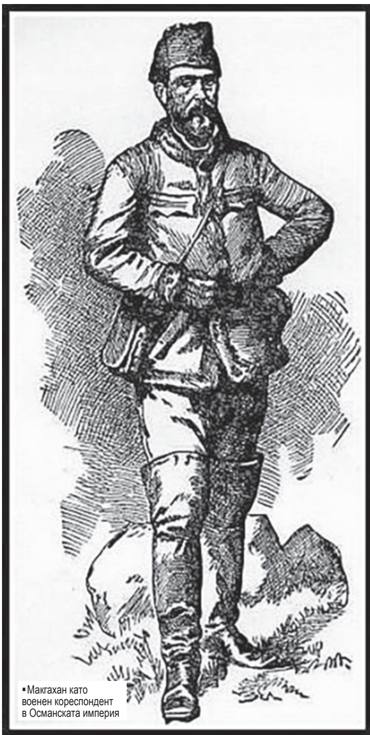
■ Макгахан като военен кореспондент в Османската империя

Но нека ви разкажа какво видяхме в Батак: Ние имахме известни трудности при напускането на Пещера. Представителите на властта бяха обидени поради това, че г. Скайлер отказа да вземе турски чиновник с него, и запovedаха на жителите да ни кажат, че тук няма