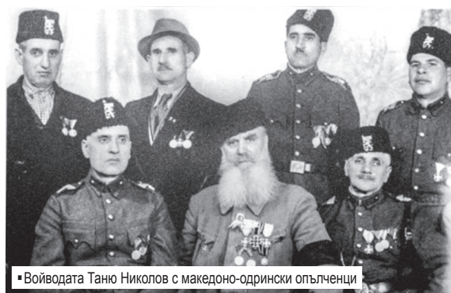
Войводата Таню Николов с македоно-одрински опълченци

На няколко табла са изложени снимки и текстове за ранните години в Хасково, за семейството и военната кариера на легендарния войвода, участието му в борбите за освобождение на Тракия и Македония. С четата си той участва в Преображенското въстание в Тракия, Балканската война го заварва с чета в Македония. След Първата световна война Тане Николов е избран за член на ръководството на Вътрешната тракийска революционна организация. През 1920 г. е сред организаторите на българо-турска съпротива срещу гръцкото управление в Западна Тракия. През 1922 г. е назначен за главен войвода на четите на новоосновената Българо-турска вътрешна тракийска революционна организация и ръководи 13 български и 7 турски чети. Изследователите казват, че неговите четници никога не са били разгромявани.