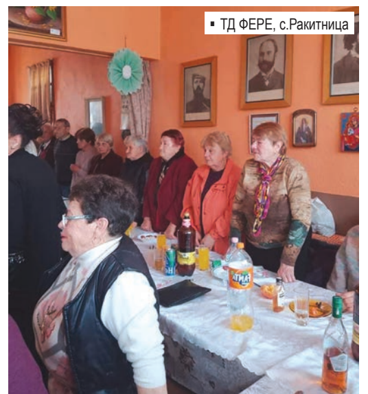
▪ ТД ФЕРЕ, с.Ракитница