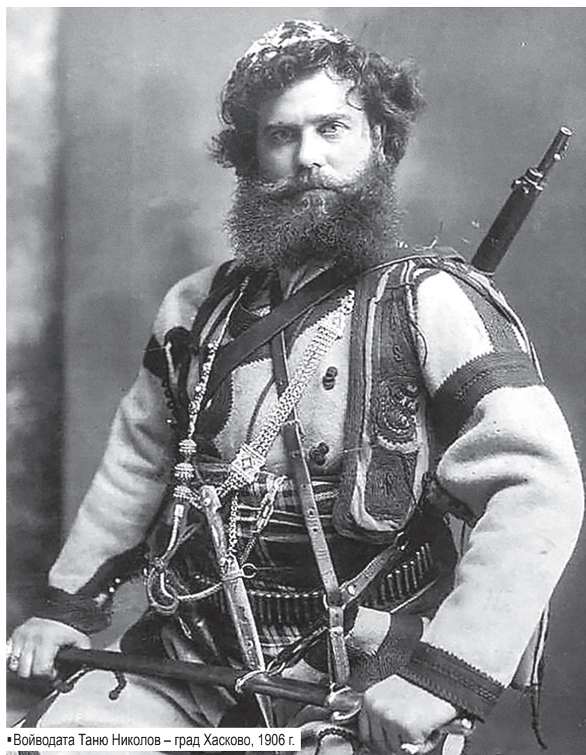
Войводата Таню Николов – град Хасково, 1906 г.

През 1993 г. хасковският музей издаде сборник със заглавие „Таню Николов – войводата“ с доклади и научни съобщения на историци и краеведи.