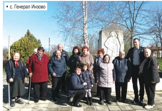
▪ с. Генерал Инзово