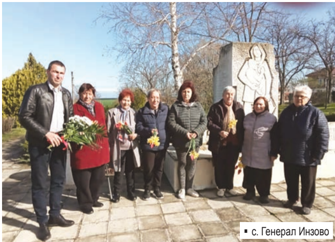
▪ с. Генерал Инзово