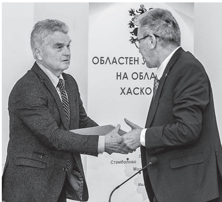
ЗЛАТКА МИХАЙЛОВА

Новоизлезлият том 12 на сборник „Тракия“ бе представен през многобройна аудитория в зала „Марица“ на Областната администрация в Хасково. Той е издание на филиала на Тракийския научен