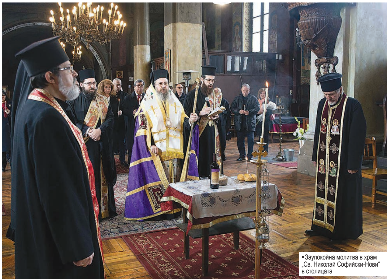
• Заупокойна молитва в храм „Св. Николай Софийски-Нови“ в столицата