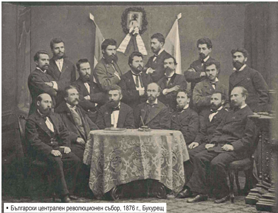
Български централен революционен събор, 1876 г., Букурещ

по това време за духовното великопение на държавата ни са знаели само тънките познавачи на Източните Балкани. Но с това усилие, благодарение и на пресата, и на мъченичеството, даваме