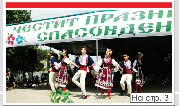
На стр. 3