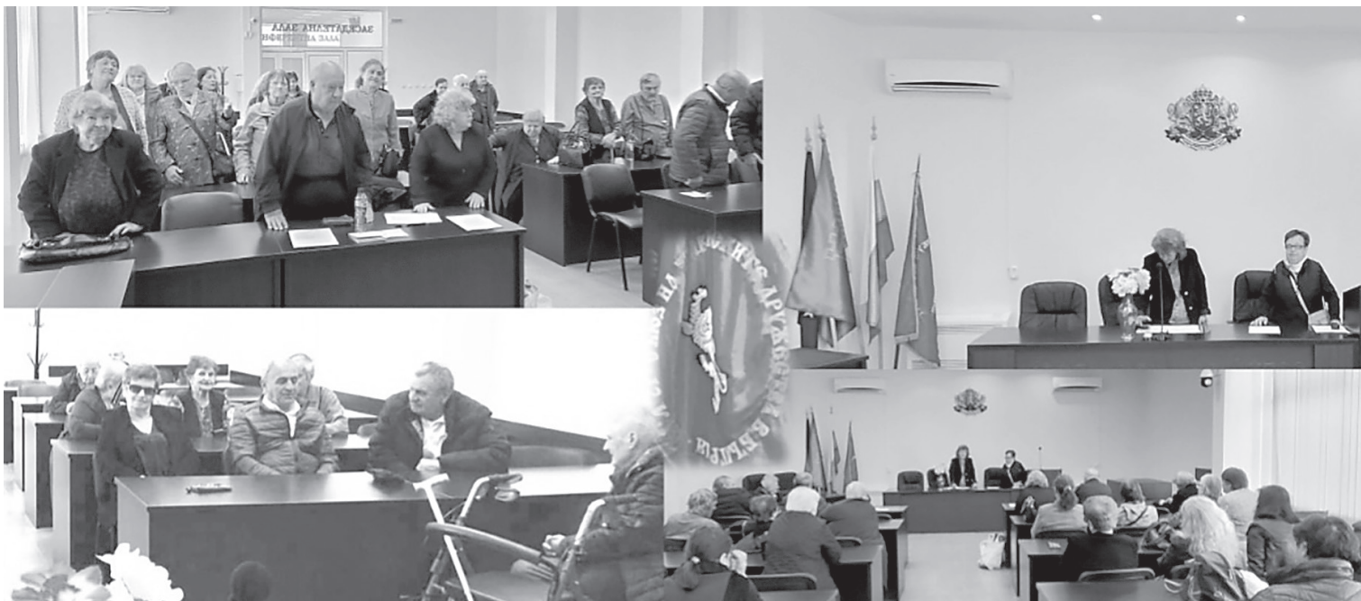
Тракийско дружество – 1897 „Петър Киприлов“, гр. Айтос