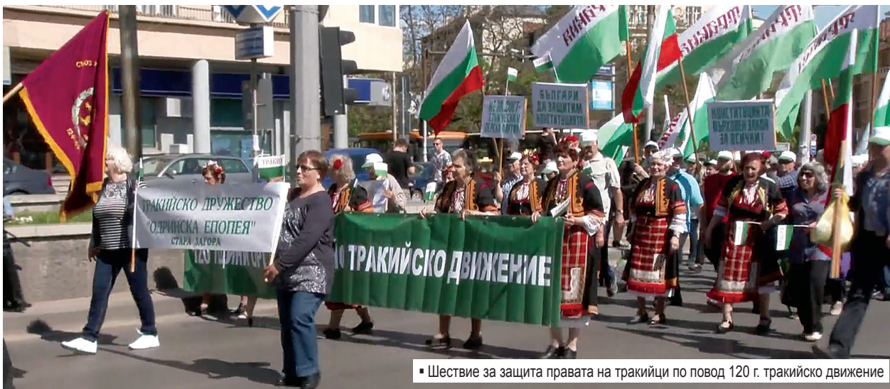
Шествие за защита правата на тракийци по повод 120 г. тракийско движение

През август 1924 г. се създава Тракийски младежки съюз, а през 1933 г. – Тракийски женски съюз като неделима част от Тракийската организация и заедно с нея работят за постигане на целите и задачите на тракийци.