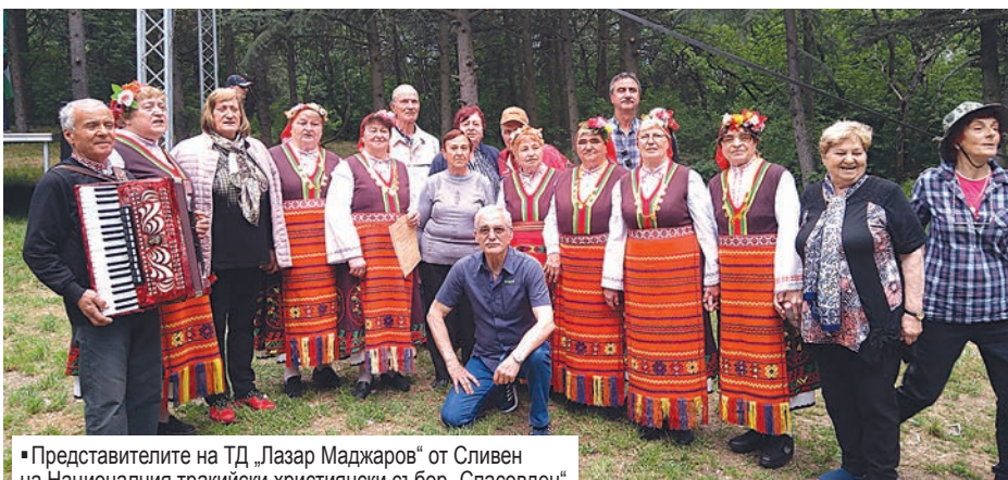
■ Представителите на ТД „Лазар Маджаров“ от Сливен на Националния тракийски християнски събор „Спасовден“