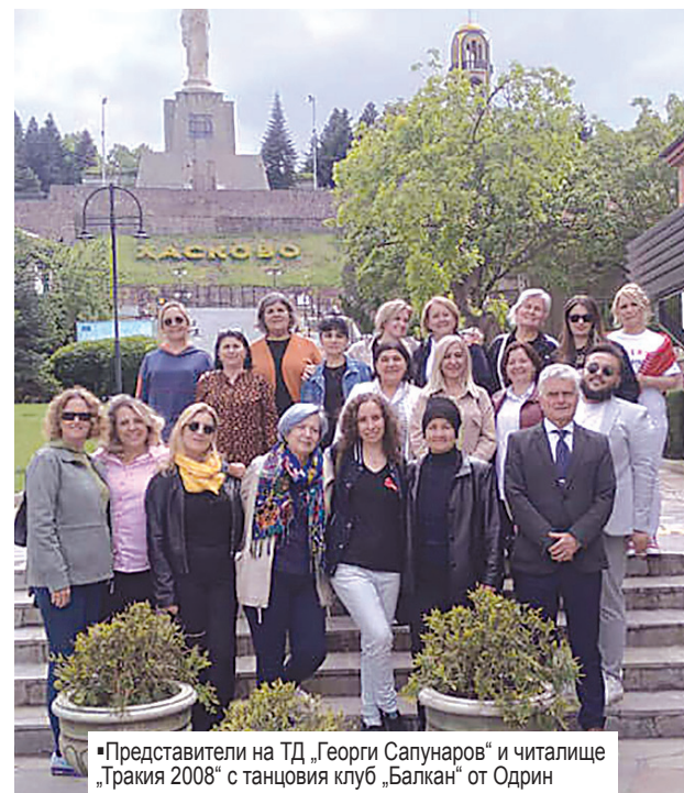
Представители на ТД „Георги Сапунаров“ и читалище „Тракия 2008“ с танцовия клуб „Балкан“ от Одрин

дипломатическата ни мисия в съседна Турция. Гостите от Одрин посетиха забележителности в Хасково,