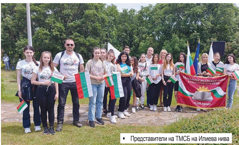
Представители на ТМСБ на Илиева нива

Община Ивайловград и Съюзът на тракийските дружества в България за поредна година организираха Национален младежки тракийски събор – поклонение, посветен на 110 годишнината от злокобната 1913-а, когато турски войски и башибозук издевателства над българите в Тракия, горят села, избиват и прогонват български мъже, жени и деца от родните им места, а на „Илиева нива“ безмилостно избиват над 200 невинни тракийски деца.