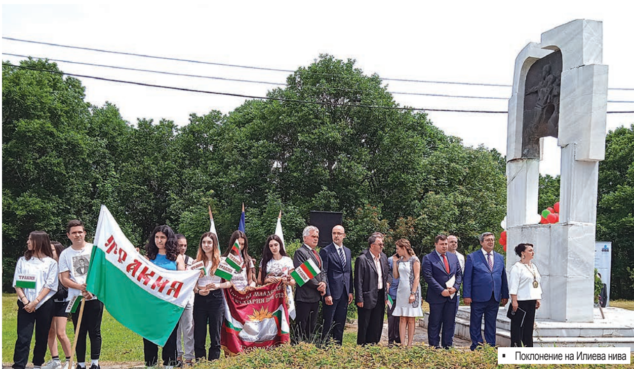
Поклонение на Илиева нива