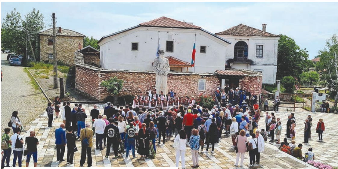
Тракийци пред паметника на Капитан Петко войвода в с. Плевун

Мероприятието продължи в НЧ „Пробуда 1914“, с представяне на Енциклопедия „Тракия“ и изложба, посветена на 125 години от