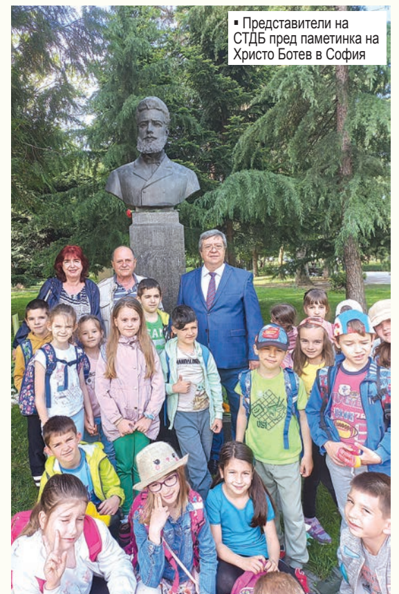
Представители на СТДБ пред паметника на Христо Ботев в София

Животът и делото на Ботев са вдъхновявали тракийци в борбите им за национално освобождение. Техните потомци, обединени в Съюз на тракийските дружества в България, се поклониха пред делото на поета-революционер в цялата страна.