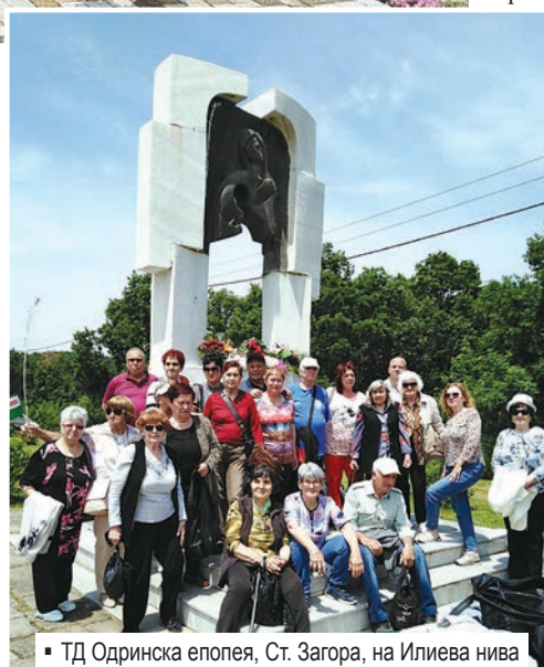
ТД Одринска епопея, Ст. Загора, на Илиева нива