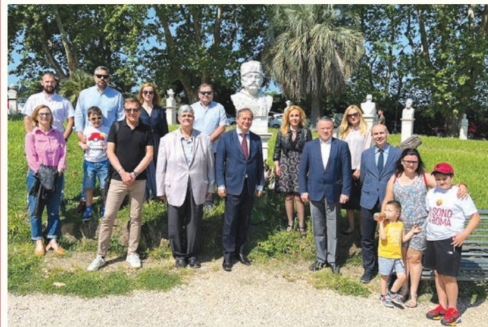
Н.Пр. Тодор Стоянов, служители на Посолството и български граждани пред паметника на Капитан Петко войвода в Рим, 2 юни 2023 г.

В Рим Н.Пр. Тодор Стоянов, служители на Посолството и български граждани поднесоха цветя на паметника на Капитан Петко войвода на хълма Джаниколо и почетоха подвига на загиналите за свободата на България, след което посетиха и паметната плоча на българските гарибалдийци.