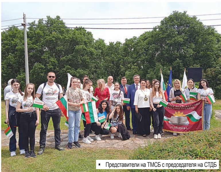
Представители на ТМСБ с председателя на СТДБ