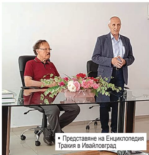
Представяне на Енциклопедия Тракия в Ивайловград

бата е станала реалност благодарение на Съюза на тракийските дружества в България и Тракийския научен институт. За нейната подготовка са използвани документи от Държавна агенция „Архиви“, Научния архив при Българската академия на науките и Националната библиотека „Св. св. Кирил и Методий“, за да се проследят в хронологично-тематичен ред основните процеси и събития в легалната и въоръжена